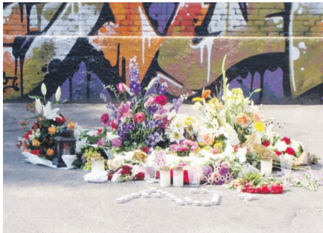
Blomster lagt for et hashhandelsoffer

Jeg er sikker på, at naturen omkring Christiania også kan bevares med staten som ejer og ansvarlig for områ-