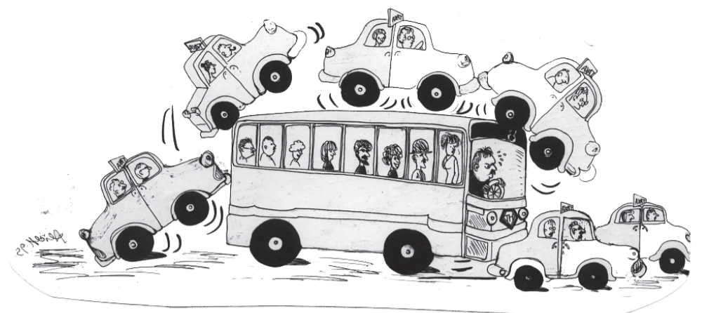
illu: Alice Hansen

Så enkelt er det ikke mere. Flertallet i Folketinget er i gang med at hindre kommunerne i at bruge disse muligheder. At kræve betaling for brug af byens gadenet er forbudt, trods gode erfaringer fra andre byer. Og senest er finanslovsparterierne blevet enige om fremadrettet at sikre, at kommunerne ikke opkræver betaling for parkering alene af økonomiske hensyn. Af finanslovsaftalen fremgår det, at partierne er enige om, at såfremt indtægtsniveauet overstiger niveauet i 2007, vil merindtægten tilfalde staten. Dog kan kommunerne un-