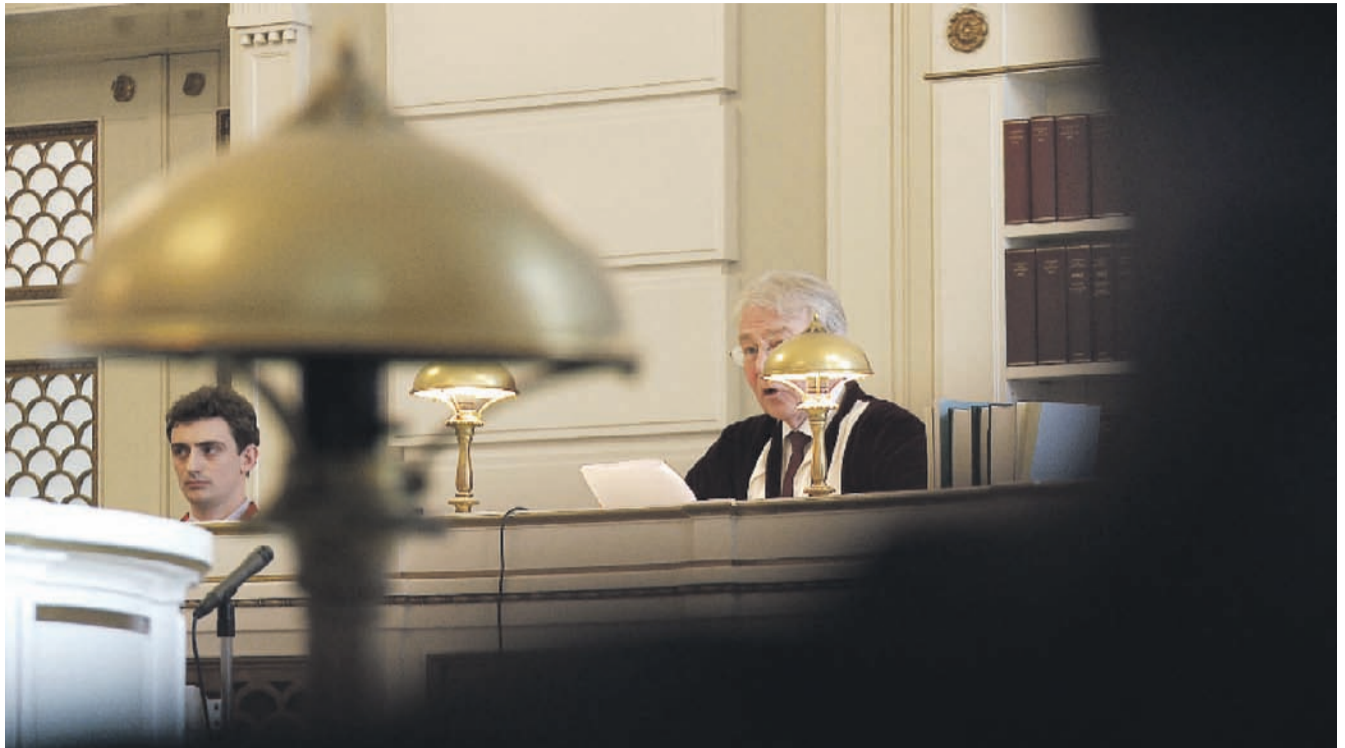
Dommen blev afsagt med musestemme, så kun få kunne høre, hvad der blev sagt