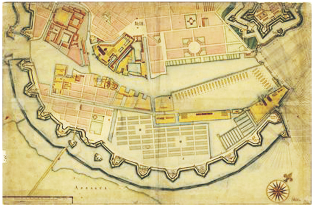
Plankort fra 1761