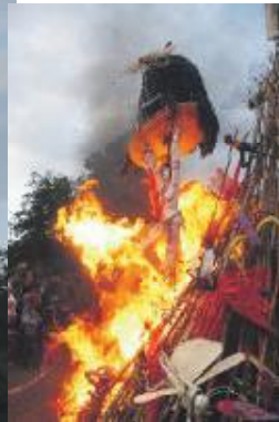
Den Islandske Systue havde lavet fantastiske figurer til børnebålene