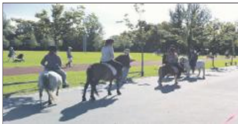
...kom til morgenkaffepå Arsenaløen, lån en hest, prøv en kajak