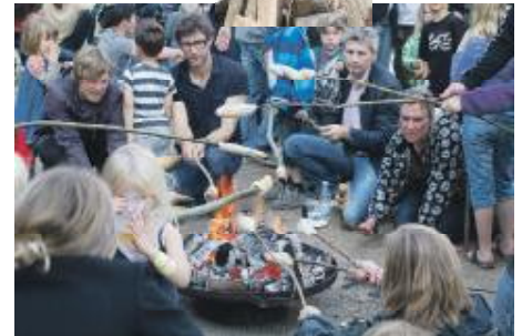
Der var rift om snobrødene