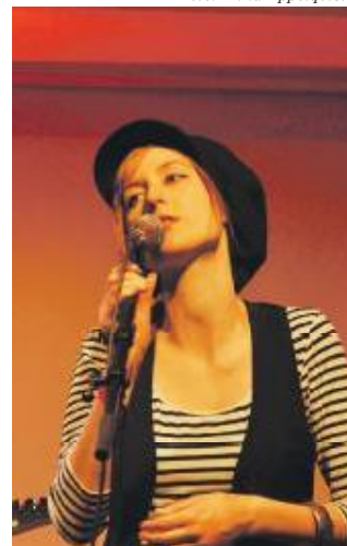
De bedste hilsener Christian- havns Lokaludvalg