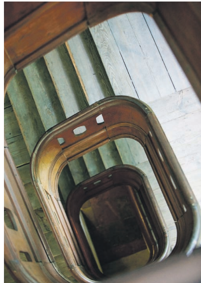
En af Eigtveds smukke, smukke trapper