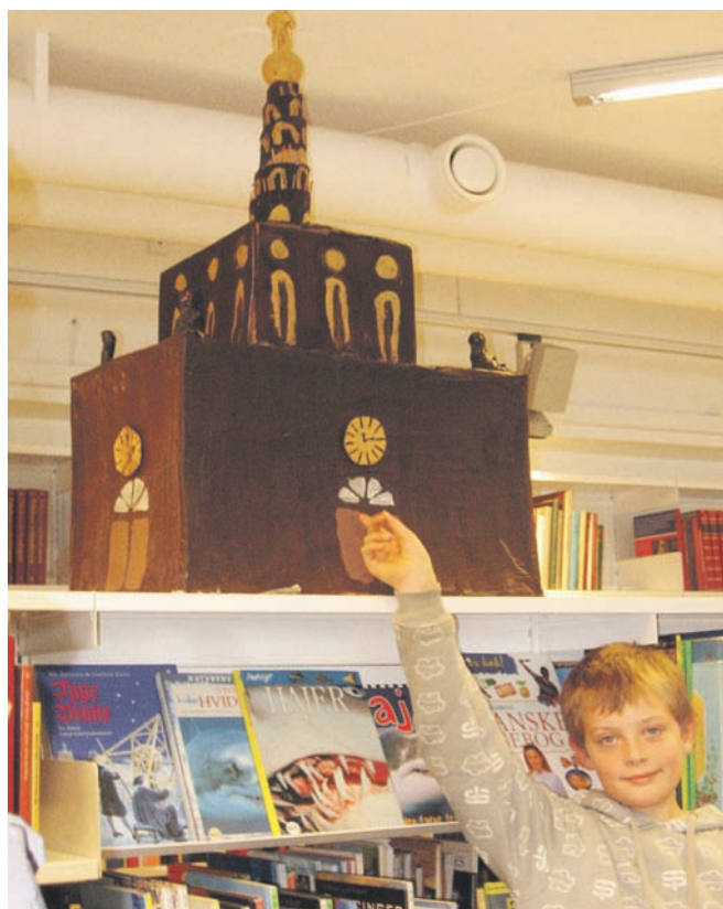
Tårne flot Otto har lavet frelserkirkens tårn