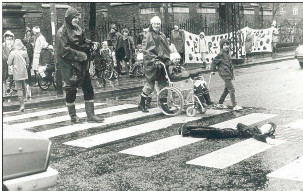
Fra demonstration for sikker skolevej i april 1983. At der stadig skal kæmpes beviser politikernes arrogance.

Mød op tirsdag den 1. februar kl. 16.30 - 18 i Christianshavns Beboerhus