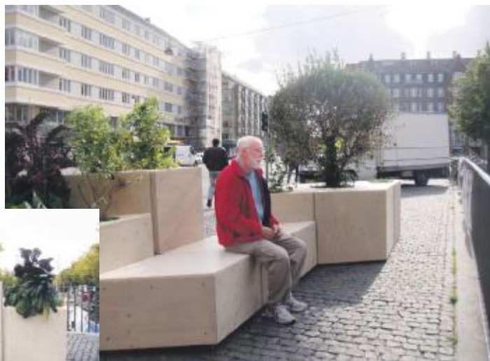
Mobile træer yder også en smule afskærmning mod Torvegades trafik, så man i fred kan nyde udsigten over kanalen