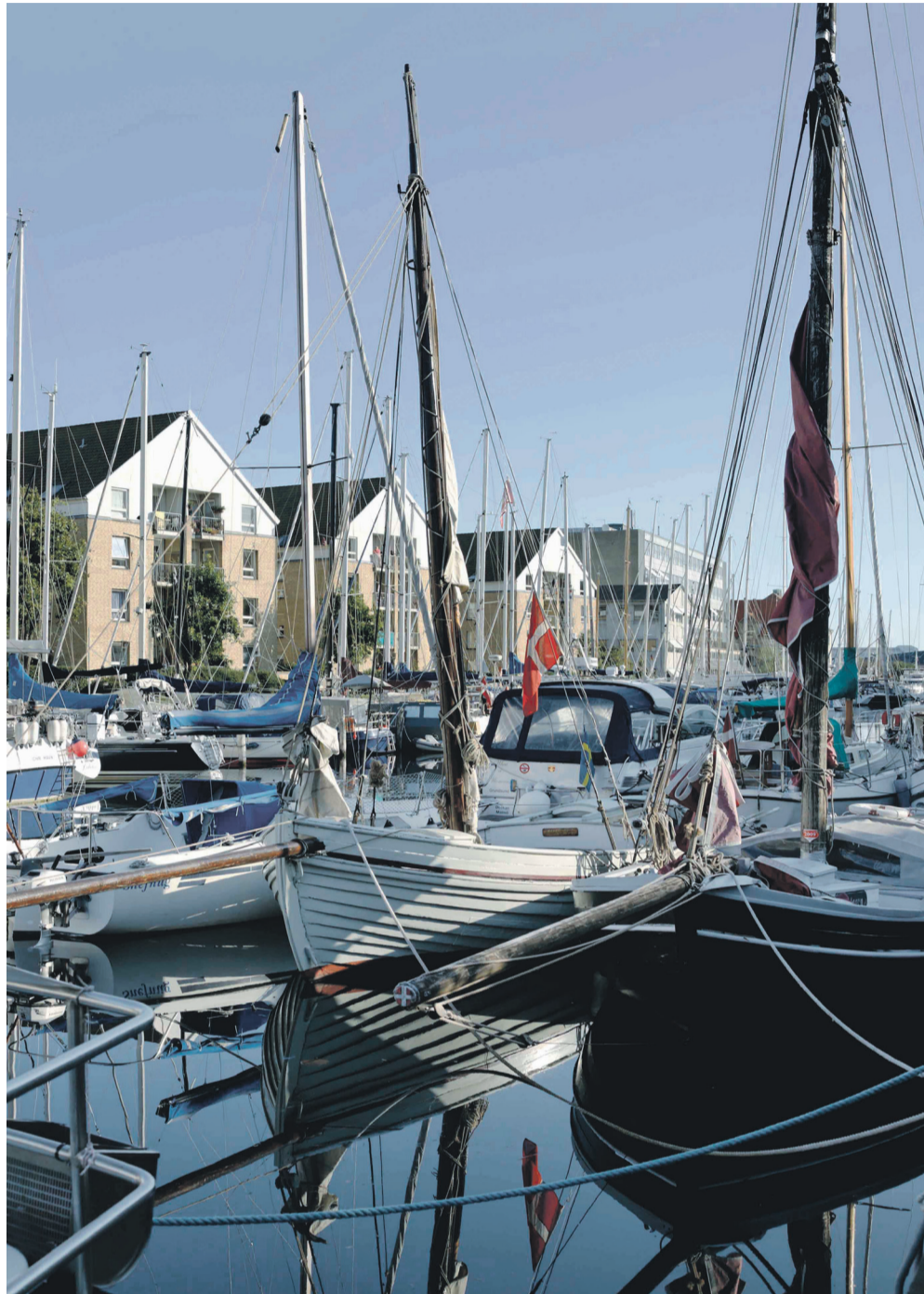
Sejlskibsmiljø med lugt af tjære og saltvand præger kanalen som det har gjort i 400 år. Men bygges broerne, er det slut.