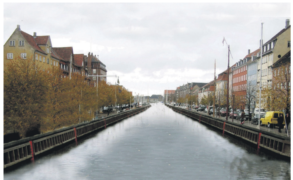
Dette kan blive tæt på virkeligheden, hvis Københavns Kommune får gennemført broer over kanalerne. Sejlerne vil finde andre fortøjningspladser, og livet på kajen vil svinde ind, hvis der ikke længere sker noget på vandet. Montage: Henning Larsen.

Se indslag om havnen på www.christianshavns-kvarter.dk