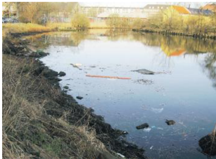
Og rengøring er tiltrængt, så tag dine waders med