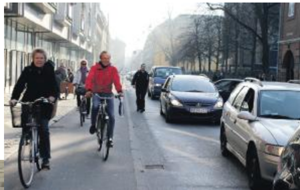
Prinsessegade i myldretiden, ingen fornøjelse

Kagen med Sikker Gade-gruppens logo, er lavet af Lagkagebageren (tak for nedsat pris) og den bliver/blev overrakt til politikerne i Teknik- og Miljøudvalget til mødet den 26. marts for at fortælle, at der stadig er stor opmærksomhed på Christianshavn om trafiksaneringen i Prinsessegade, og at de lige skal tygge en ekstra gang, før de vedtager et ualmindeligt utilstrækkeligt forslag, som blot indeholder nogle få asfalter bump. De påtager sig derved et meget stort ansvar for omkring 2400 børns liv og helbred.