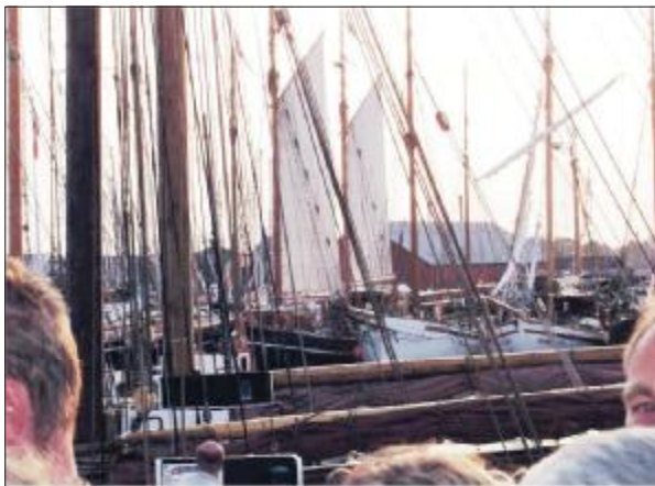
Masteskibe med sejl, altid et fantastisk flot syn, forhåbentlig forsvinder de ikke helt fra Christianshavn og omliggende