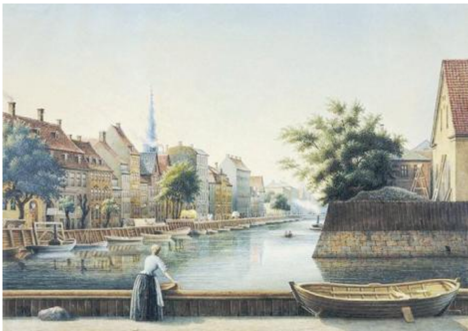
Overgaden Oven Vandet 1888.

Til venstre Burmeister og Wain, til højre husrækken i Overgaden med den gamle politistation og fængselsbygning samt Vor Frelser Kirkes spir. Akvarel af C. O. Nielsen.