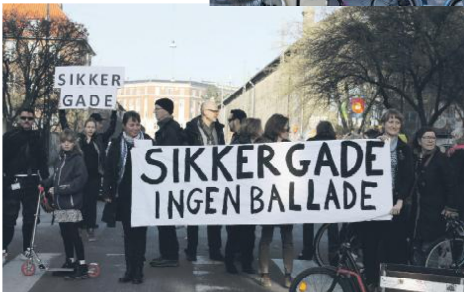
Lokal-pressen var på pletten

For børnefamilierne er Sikker Gade en rigtig vigtig sag, og mange var mødt op med cykelanhængere osv.