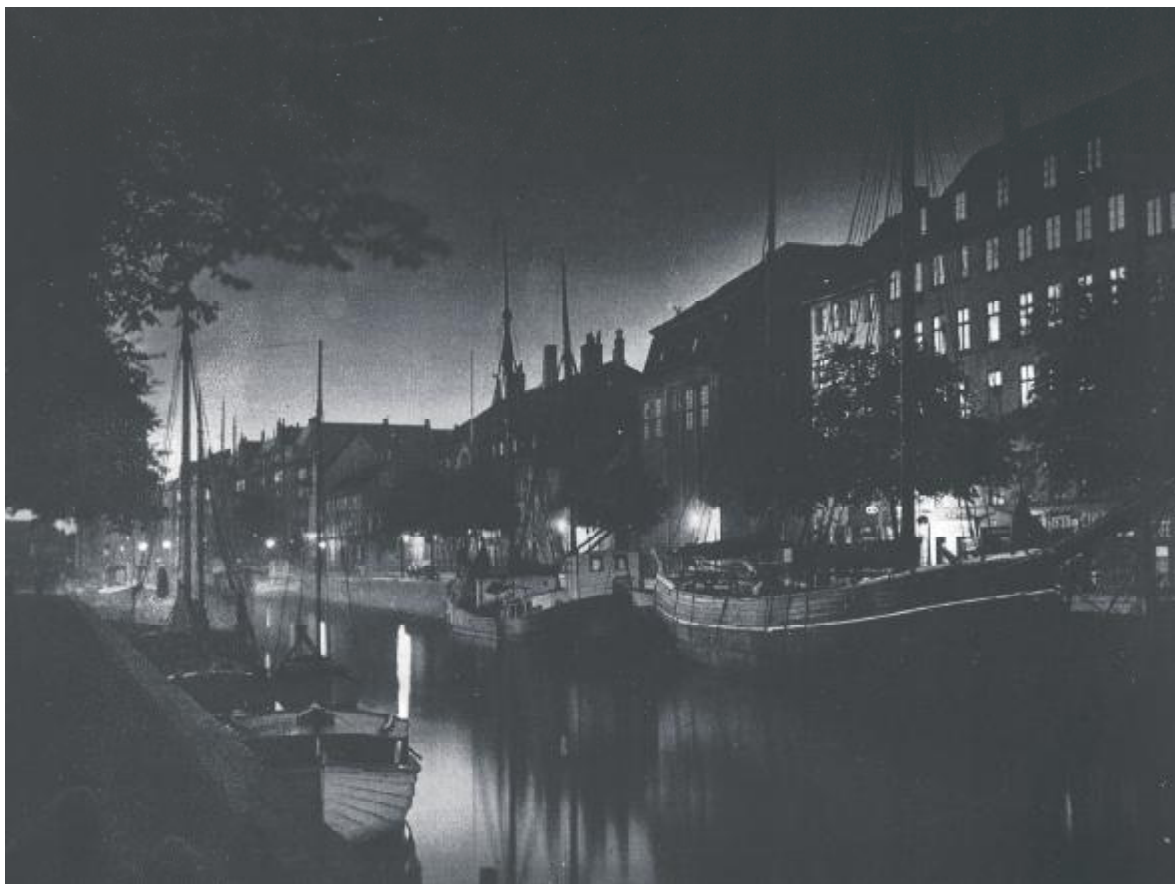
Det medsendte billede fra Overgaden oven Vandet er retoucheret og læg mærke til bagerkringlen