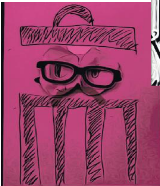
Stilbillede fra filmen "Ud af vinduet". Superhelten kommer til undsætning.