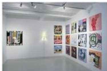
De har vist os meget, og nu bliver det endnu bedre...