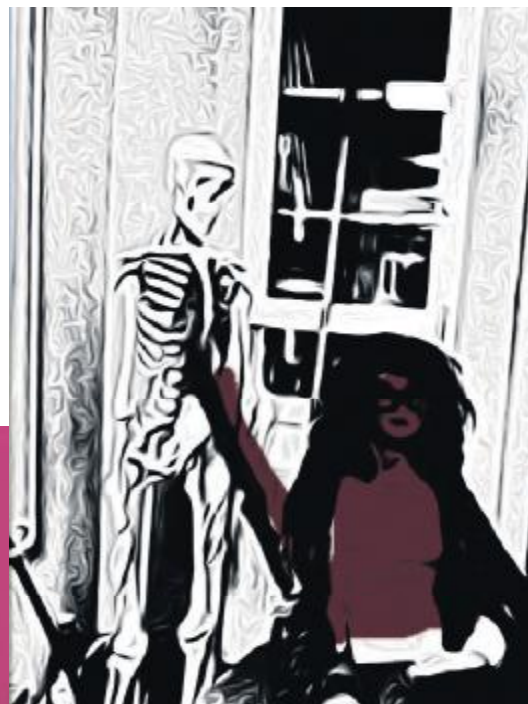
Stilbillede fra filmen "Ud af vinduet". Læreren regerer i den sorte skole