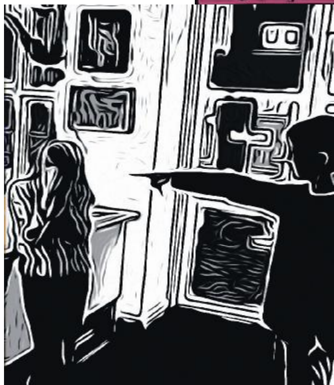
Tv: Stilbillede fra filmen "Mobbeskurken": En mobber peger af sit offer.