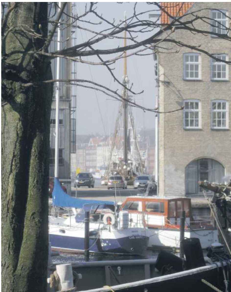
Billedet viser det skønne kig mellem Christianshavns Kanal og Nyhavn, som forsvinder, hvis Københavns Kommunes lokalplanforslag for Strandgade Nord vedtages uændret.

Så hvis du har bemærket noget mistænkeligt eller bliver opmærksom på noget, så giv en melding til Station Amager.