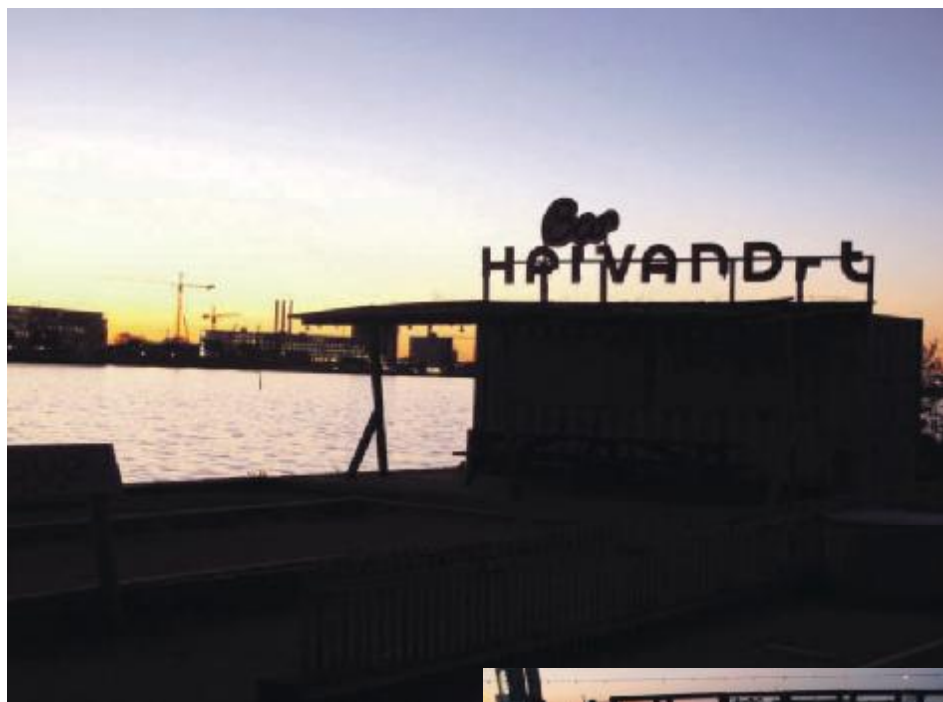
Lokaludvalgets udflugt sluttede på café Halvandet yderst på Refshaleøen, i det stille vejr var stedet helt som fortyllet, caféens chokoladekage til kaffen var heller ikke værst

Oplægsholderne udviste et dejligt gå-på-mod med hensyn til en kreativ anvendelse af Refshaleøen. Det var noget af en øjenåbner for christianshavnerne at opleve, hvad der foregår i deres egen baghave.