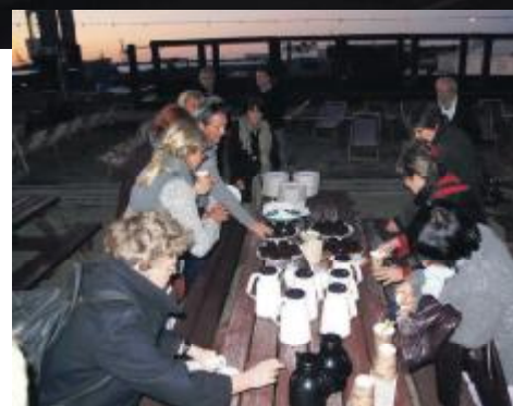
Bussen kørte videre til Halvandet yderst på Refshaleøen, hvor deltagerne i mørkningen summede over, hvordan Christianshavn kan få den ønskede stiftorbindelse ind i kommunens prioritering og hvordan lokaludvalget kan understøtte de midlertidige aktiviteter på Refshaleøen.