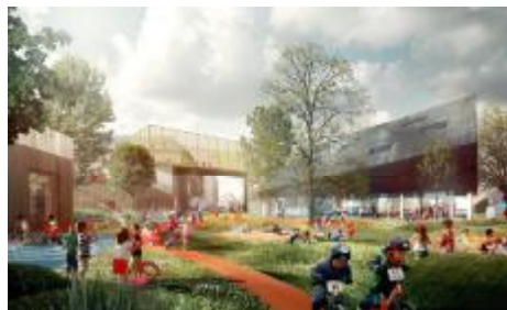
Ja smukt ser det ud, og der er mange glade børn foran og inde i institutionen - vi må håbe, at virkeligheden bliver lige så frydefuld...

dens Bedste Børneby" virker spændende og sjov, men placeringen af så stor en institution netop dér, virker simpelthen ikke gennemtænkt. Den bliver omgivet af tæt boligbebyggelse, voldsom trafik både af cykler fra den kommende cykelbro fra Nyhavn, som vil køre lige forbi og fra den vilde trafik til Holmen og Aladdin kvarteret og til den kaotiske Refshalevej. Det er synd for en god tanke, at der ikke har været vilighed i de tre forvaltninger, som er involveret i projektet, til at løse nogle af de klare infrastrukturproblemer, som belejrer institutionen fra begyndelsen!