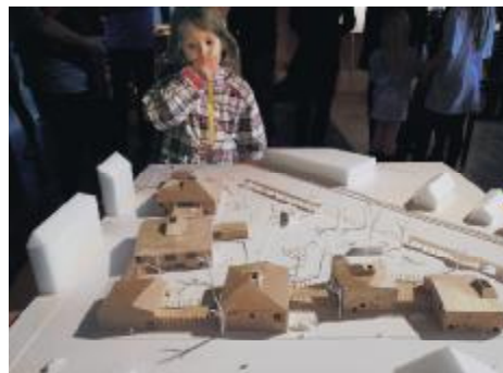
En lille, måske kommende bruger, ser lidt skeptisk på modellen af "Verdens Bedste Børneby". Gad vide, hvad hun tænker om det hele?

de mange bilende forældre, som skal sætte deres børn af på vejen til arbejde skal holde? Det viste sig, at der ikke bliver afsat parkeringspladser ved institutionen, da man forventer, at alle forældre kommer på cykel. Der bliver lavet en fin cykel-parkeringsplads inde på institutionens grund, så der skal forældrene holde! Det må vi så håbe holder stik, for det bliver vanskeligt nok for de mange, mange børn, som hver dag skal færdes i den dødsensfarlige Prinsesse-