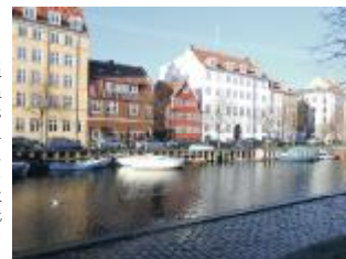
Her skulle 24 meter restaurationsflåde have ligget!

det også OK. Vi mødes omkring en gennemgang af det forgangne år, en festlig nytårstale, en hyggelig buffet og god musik og dans. Og det hele foregår i Beboerhusets sal 9, Januar kl. 1930. Ka' I ha en god jul og et lykkelbringende Nyt År! poull