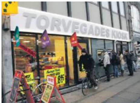
Torvegades kiosk har udvidet med nabobutikken.