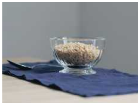
"Gestus" Af Jakob Emdal

Gådefulde billeder Det forreste rum i stueetagen henligger i halvmørke, når Ebbe Stub Wittrup indtager Overgaden. Et tungt, hvidt forhæng afskærmer udstillingen fra byen uden for i en teatralisk gestus, der markerer indgangen til et univers, hvor almindelige