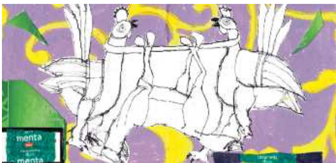
"Venice" et billede af Pia Fønnesbech