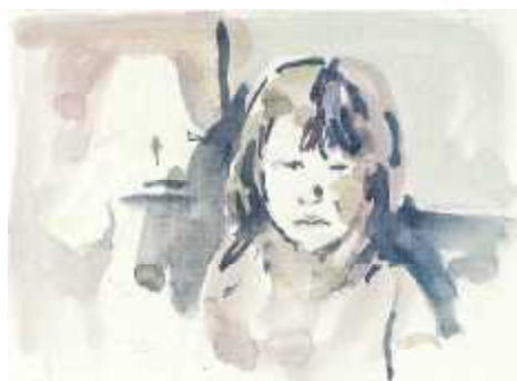
Søren Birk Pedersen "Portretstudie", akvarel, 2011

Maleri - Grafik - Billedvæv - Keramik - Skulptur