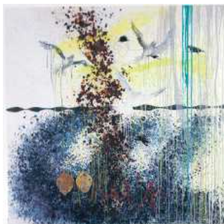
Foto: Smon Lautrop "Fuglene" (olie og papir på lærred 180 gange 180cm)

Ina Rosing har altid arbejdet med både sin grønlandske baggrund og med sin eksistens i verden. Hendes emner kan være kroppen og naturen, men også intensiteten i hendes indre landskaber som kan være præget af uro, jalousi, vrede, lyst, kærlighed og nydelse osv. - og det er blevet temaer, som igennem tiden har givet