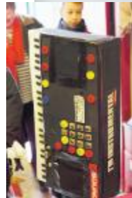
Forklædt som keyboard og ...hvordan er det så at være Guldbarre?