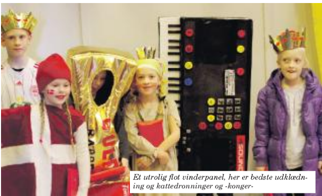
Et utrolig flot vinderpanel, her er bedste udklædning og kattedronninger og -konger-