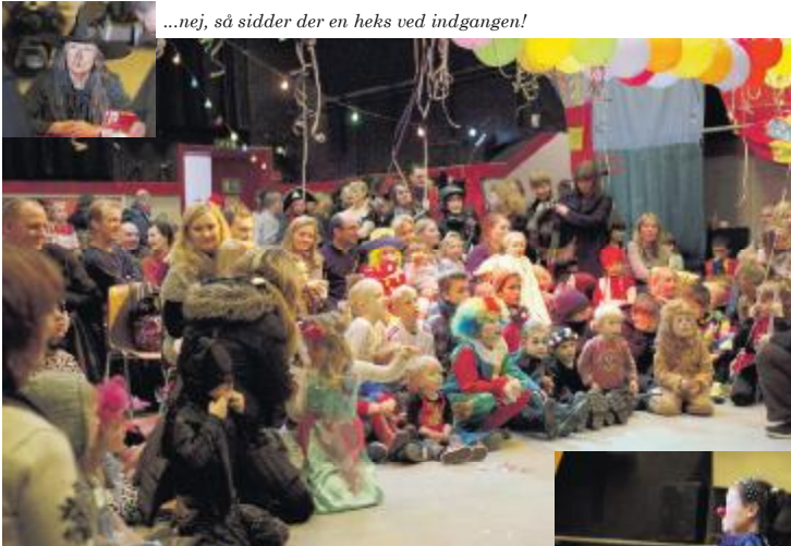
...nej, så sidder der en heks ved indgangen!