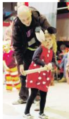
Der slås både med små og store slag...