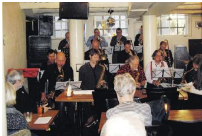
Et udsnit af Det Hemmelige Big Band for fuld udblæsning!