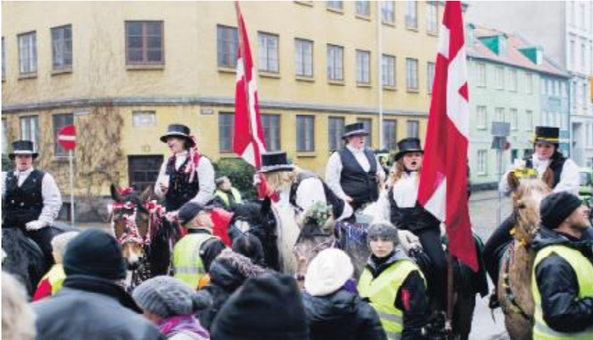
Tommerupvangrytterne kom, traditionen tro sang de "Så gi'r han nok en lille en, en lille en, en lille en..." ...og de fik så en lille en.