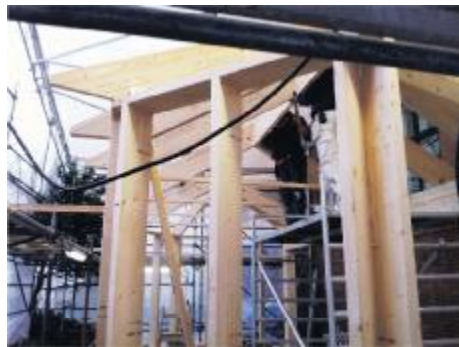
Tilbygningen gemmer sig lige nu under et stilladstelt

Man kan allerede danne sig en fornemmelse af bygningens rummelighed, næsten høre vandet skulple og føle varmen og det velbehag, som fremtiden vil bringe.