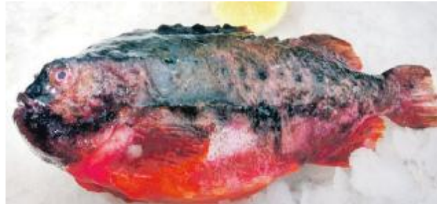
Stenbider i forårsfarver...

Nå, men vi skal også i køkkenet i dag - foråret nærmer sig, og når I læser avisen, håber jeg, at solen skinner lækkert og varmt, fuglene synger, græsset grønes osv. En sikker forårsbedunder er stenbideren, der bliver interessant at fange på disse tider: Fru stenbider – der lyder det det lidet flatterende navn kvabso – er gastronomisk ret uinteressant – kedeligt, geleagtigt, slasket kød uden ret megen smag – men hun bærer på en rigtig delikat rogn, der er på sit højeste netop nu. Oftest fås rognen rensat for hinder, men hvis ikke, så smid den i koldt vand og pisk den forsigtigt med en gaffel til hinderne er væk. Den klassiske anretning er med blinis