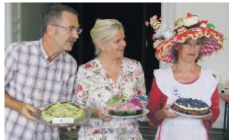
De tre dommere i aktion