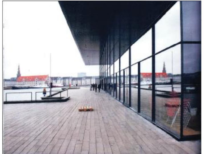
Vor Frelsers Kirketårn kan ses overalt - næsten - for hvis Eric van Egeraaths 5 huse var blevet bygget, så havde de dækket helt for udsynet til spiret - og hvor meget vil mon det kommende byggeri på Krøyers Plads tage af dette unikke og smukke kig ind til Christianshavns helt enestående vartegn??

Det blev en flot og festlig afslutning på fejringen af tårnets fødselsdag – men tilstrømningen af nysgerrige christianshavnerne kunne ikke måle sig med de mange, der kom strømrende den dag i 1990'erne, hvor man hejsede "manden på Kuglen"