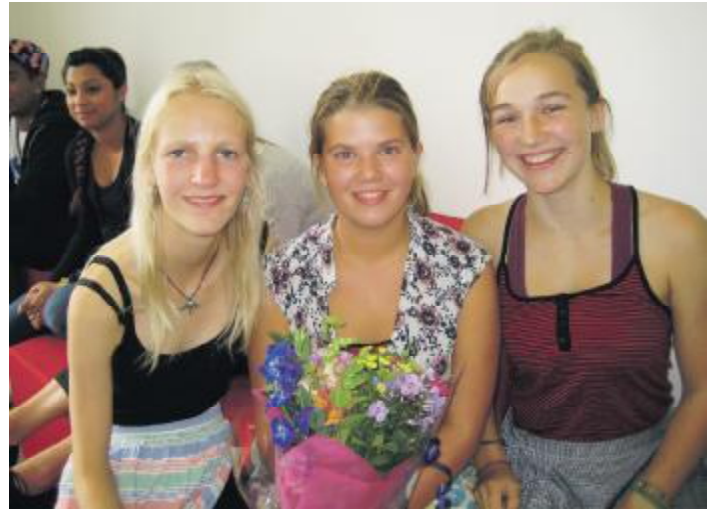
De tre unge piger der havde lavet kagen 'Peace of cake'.