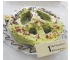
Peace of Cake, vandt på kreativitet eller originalitet, som Anne Marie Helger udtrykte det