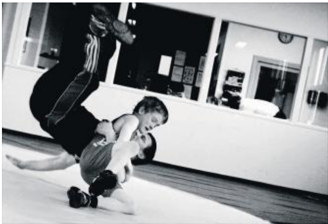
C.I.K.s Ungdomshold til en almindelig træningsaften