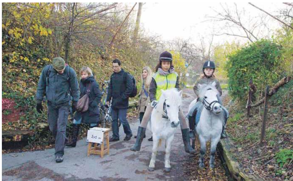
Stigennemføringen ved den historiske vold er 3,05 meter bred. Området er fredet og en udvidelse er ikke tilladt af fredningsmyndighederne.

Se flere billeder på Facebook: https://www.facebook.com/media/set/?set=a.485761145409.264299.586060409&type=3