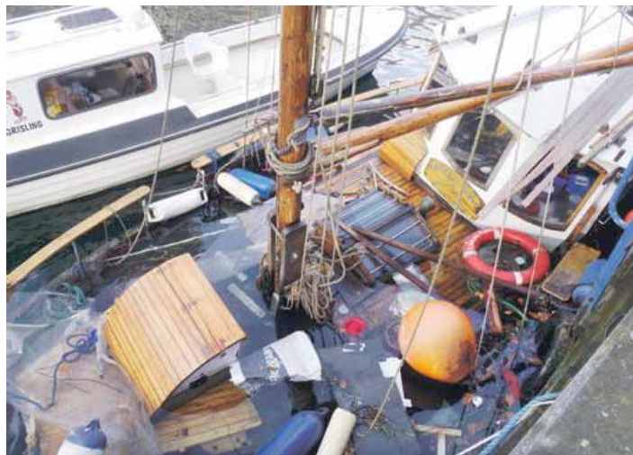
Den gode kutter, Lykkens Prøve, bukkede under i den kraftige storm den 1. februar, mens den lå til kajs på Christianshavn.

Om føje tid vil de eneste skibe i Christianshavns Kanal være milliondyre kaljiggede glas- og stålskibe, hvis ejere sjældent ses aktive om bord. Uanset hvilke sejladshæmmende havnebroer