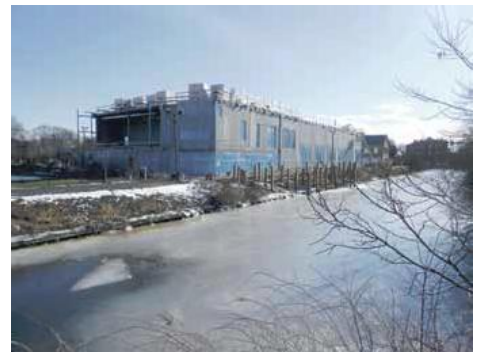
Multihal 6. feb

Teaterentusiaster spørger om kulisser kan opstilles og stå til flere dage? Det kan nok give logistiske problemer. Og