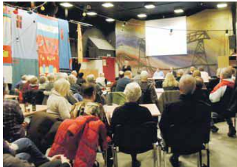
Lokaludvalgets møde i Beboerhuset om Multihallen

Det er så sådan, at fra 8 til 16 på hverdage har Havnens skoler fået forrang og de tre skoler, Døttreskolen, Christianshavns Skole og Gymnasiet har store behov. De har meldt ind og i et samarbejde ser det ud til, at de alle lige kan få passet deres ønsker ind.