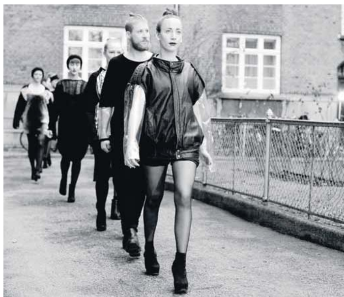
Christianshavns Vold prydes i vinterkulden af nordisk mode.