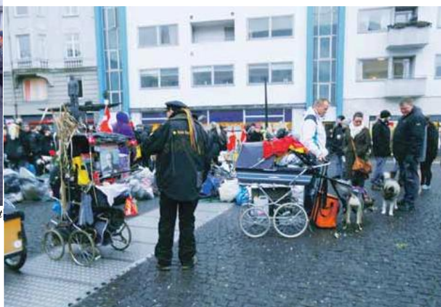
"Tænk med Hjertet"s aktion førte mange forskellige typer sammen på Torvet