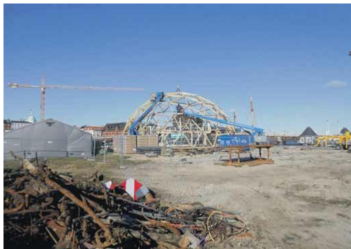
Dommen rejser sig over den opgravede Krøyers Plads

Der er således lagt op til at afprøve flere spændende modeller for mere bæredygtigt byggeriforsøg i dommen end det vil være muligt i det kommende store byggeri, som bliver bygget på Krøyers Plads.