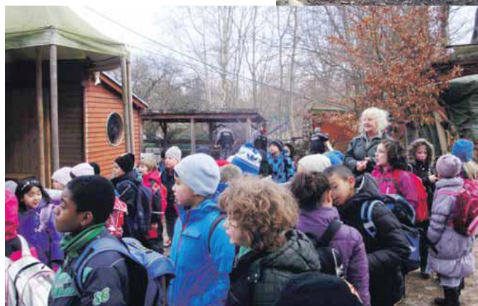
Lis omgivet af børn - i de 15 år hun har ledet Naturværkstedet, er der gået omkring 70.000 børn gennem stedet