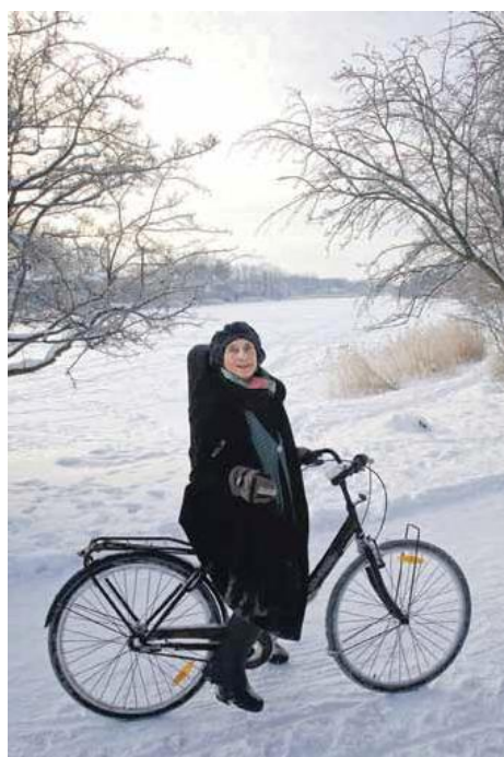
Alle er velkomne til en fredelig cykeltur gennem Christiania og hen over Dysebroen, også socialdemokrater i Borgerrepræsentationen.

Christiania har nok, mere end nogen anden bydel i Danmark, både gået imod bilisme i beboelsesområder og arbejdet for, at man hellere skal tage cykel end motoriserede køretøjer. Den trehjulede ladcyclet, kaldet 'Christiania Biken', har i den grad været med til at få forældre til at transportere deres børn i vuggestue, børnehave og skole på en miljømæssig og hensynsfuld måde, fremfor at køre dem i bil. Det vurderes,