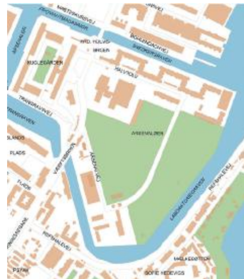
Arsenaløens grønne område kan skabe mulighed for et godt skolemiljø for børnene