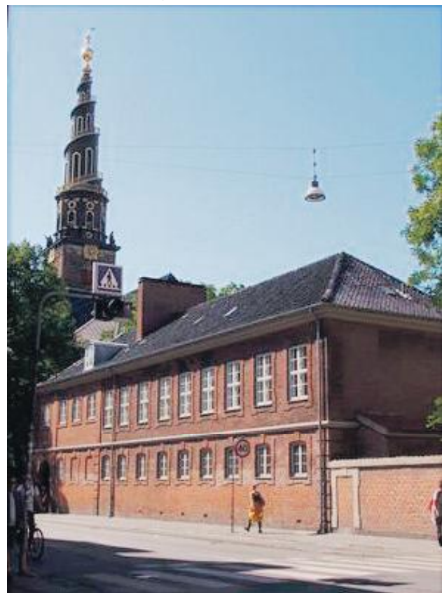
Foto af den ene del af Christianshavns Gymnasium i Prinsessegade, den anden del ligger lige overfor, i den tidligere cigarfabrik, Nobels bygning.