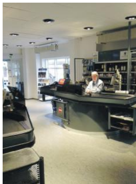
Vores utrolig søde "Irma-pige" i nye og lysere omgivelser

Tekst og fotos: Bjarne Andersen, Butikschef.