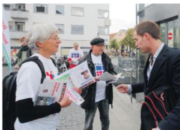
Nej til EU på Torvet

Københavns kommune ikke bruger sit overskud på 9 milliarder?