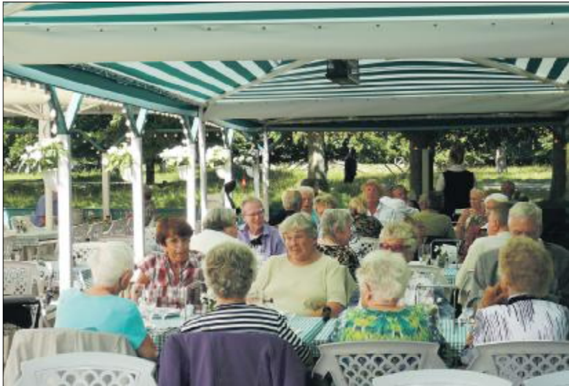
Tekst og foto: Finn Andreasen (Dress), Voldboligerne

Jeg vil her benytte lejligheden til at takke dem for deres utrættelige arbejde og sam-tidig nævne at de frivillige for nylig har modtaget en frivillighedspris fra KAB.