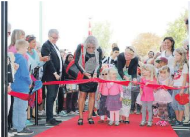
Snoren klippes til Hal C

Da vi var til åbningen af Hal C, ku vi sidde på terrasserne ud mod laboratoriegården og slikke dejligt solskin. Men det blev også åbenbart, hvor dødssygt – for ikke at sige livsfarligt – det vil være at blande en ny cyklesti ind i dette.