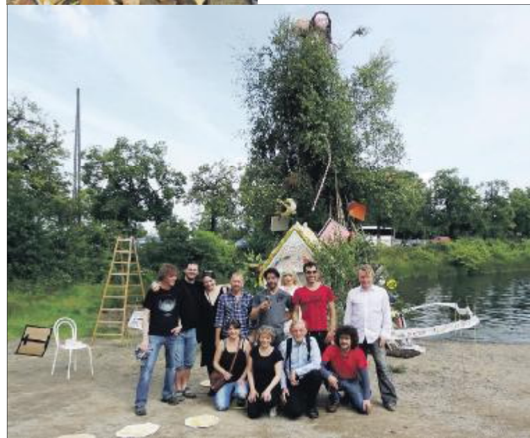
Systuefolket med hjælpere ved et tidligere bål

Sankt Hans er magisk - hvem blir forvandlet?