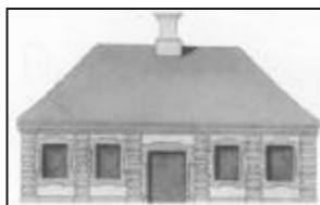
Besøg Vagthuset for foredraget og filmen. Åbent mellem 13 og 15