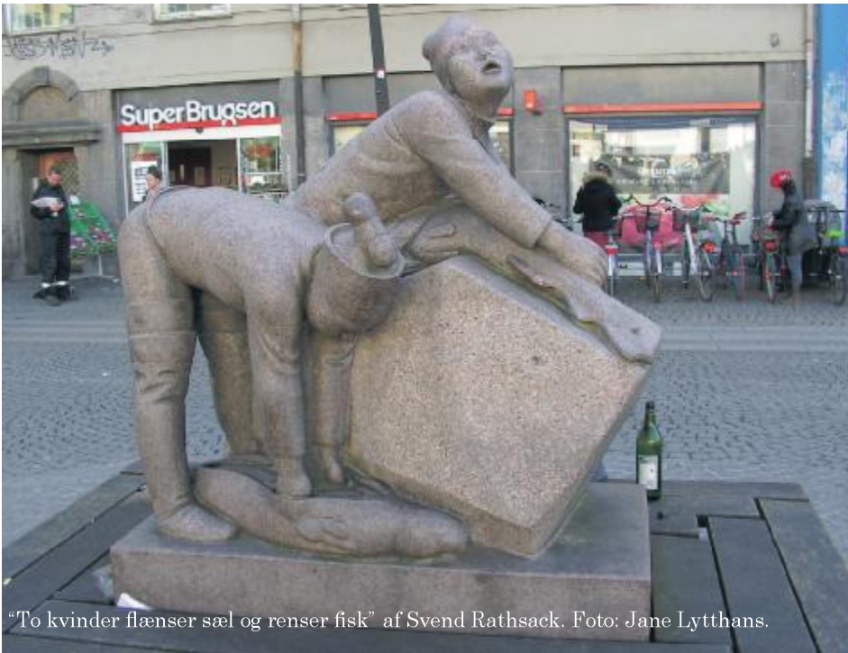
“To kvinder flænser sæl og renses fisk” af Svend Rathsack.