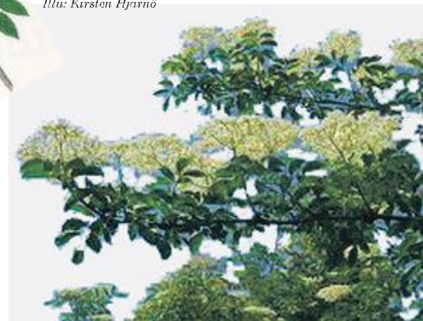
Hylden, en virkelig magiker