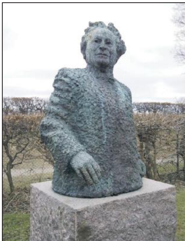
Martin Andersen Nexø. 26 juni 1869 – 1 juni 1954 er kendt af de fleste danskere for romanerne "Ditte Menneskebarn" og "Pelle Erobreren".

Filmen vises på Christianshavns Bibliotek, Dronningensgade 53 kl. ca. kl. 16.