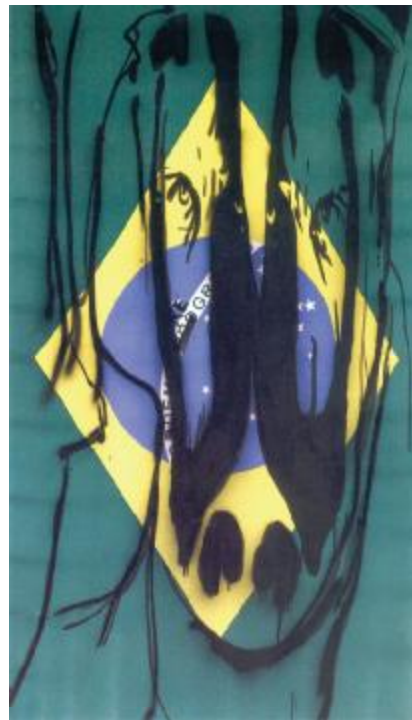
"Drengene fra Brasilien, 2009" Her symboliseres det brasilianske flag med fodbolden..