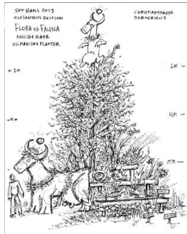
Péturs fine arbejdsstykke

Tekst og illustration: Systuen "Den Røde Tråd"