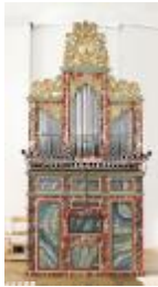
Spansk barok-orgel besøger kirken