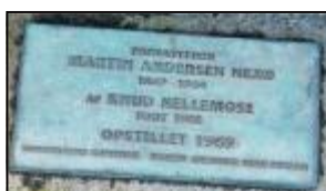
Christianshavns Lokalhistoriske Forening & Arkiv www.chrarkiv.dk