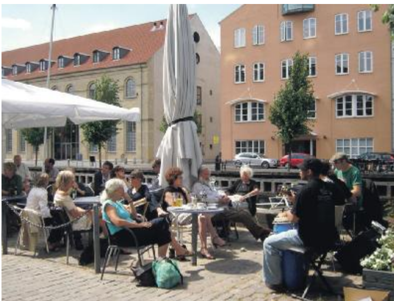
En herlig sommerdag med jazz på bolværket ved en tidl. festival. Til venstre ses et forventningsfuldt - og varmt - festivalpublikum.

De med *) betegnede koncerter er udendørs. Ingen Entré.