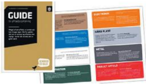
Kommunen har rundsendt farvede mærkater til husstandene

Kilder: Københavns Kommunes hjemmeside og brochuren "Guide til affaldssortering"