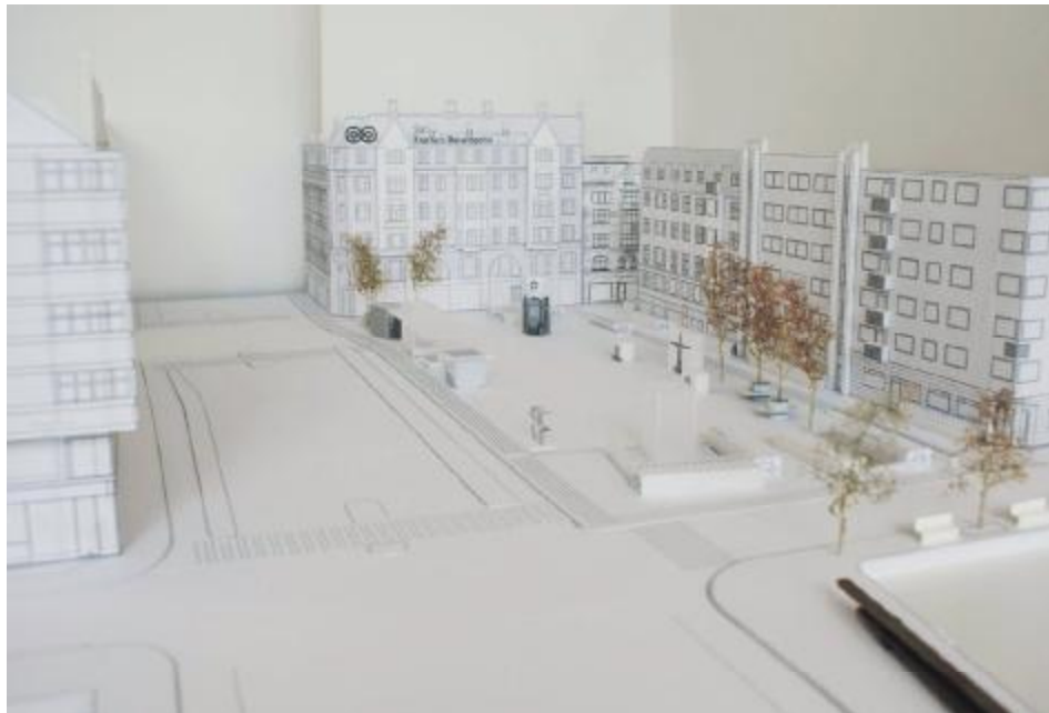
Model af det forbedrede Torv.