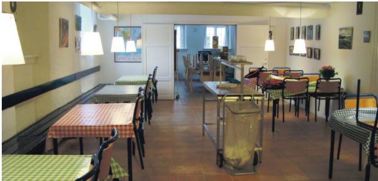
De nyrestaurerede lokaler i Fedtekælderen - medsendt foto