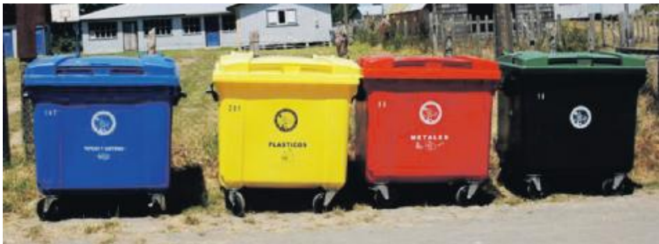
På længere sigt håber vi på skralde spande i de farver der svarer til mærkaterne