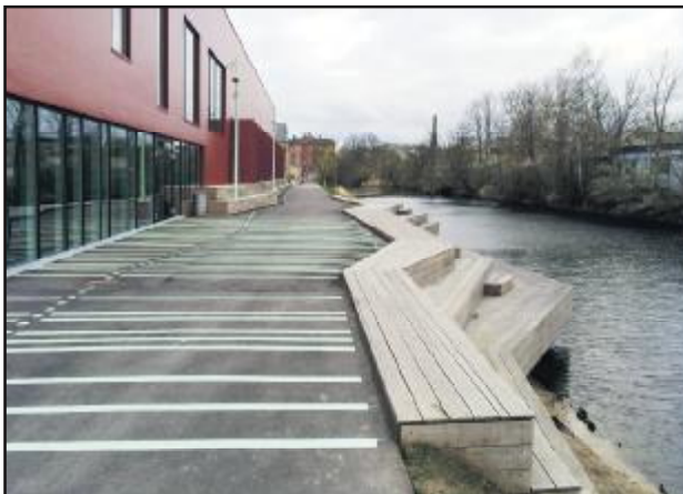
Her har kommunens politikere ment, at det var en god idé at lade cyklister i tusindtal køre frem og tilbage hver dag. Det er ellers her, at hallens brugere skal kunne gå udenfor og slappe af med kaffe og andet, og her, at både lægger til. Forestil Jer stedet en varm sommerdag! - Lokaludvalget har protesteret kraftigt og står sammen med Christiania i kampen for en fornuftigere linieføring, eller flere.

3. På 2 konkrete områder er linieføringen helt i skoven: Den nyopførte Hal C er forsynet med et fantastisk terrasse-