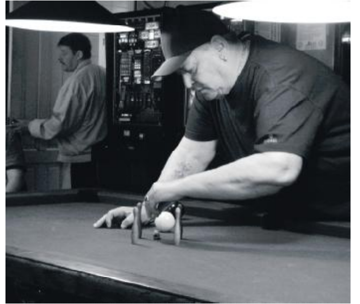
Dommeren stiller op til spil