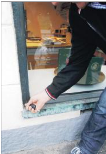
En vinduesrude er let at tage ud, men der findes specielle skruer som gør det meget svært.