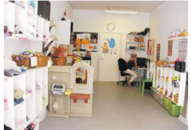
Børnecafeen i Genbrugsen i Torvegade