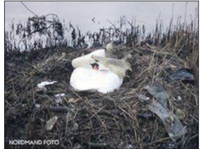
Svane på rede.

Lav retningslinjer for sejlsads i Inderhavnen som tager hensyn til fuglelivet.