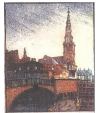
Fin radering fra Schlottmanns Raderingsforening med motiv fra Snorrebroen.