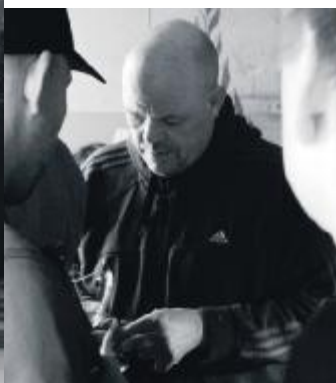
PJ samler indsatser