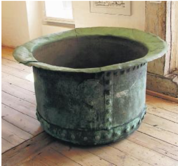
Trankogekar af kobber. Det står nu fint rensat men tydeligt velbrugt på Nordatlantens Brygge.

KGH flyttede i slutningen af 1980'erne til Ålborg og efterlod en stor plads med store smukke lagerbygninger, som vi nu bl.a. kender som Nordatlantens Brygge, en meget uheldig administrationsbygning og mange mindre lager- og værkstedsbygninger.