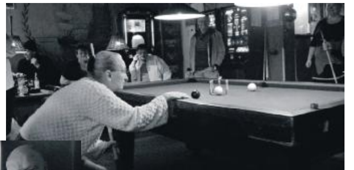
Gutinder vurderer før de støder...

Skærtorsdag blev der afholdt Falken's lokale billardturnering som prikken over i'et på vores deltagelse i Amagerturneringen, hvor vi kan "bryste" os af en flot 2. plads!