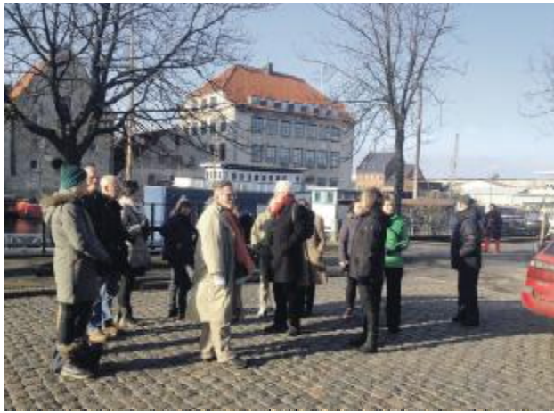
Green Walk, kigger på træer

Omkring 30 interesserede borgere fra lokalområdet mødte op. Hensigten med arrangementet var at støtte op om at København Kommune får virkeliggjort deres plan om at plante 100.000 træer inden år 2025. Vi mødtes på Café Overgaden Oven vandet til en kop kaffe. Herefter gik turen, retning havnen, hvor der blev udpeget steder, der kunne plantes flere træer og mere grønt.