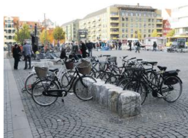
De mest eksklusive cykelstativer i byen