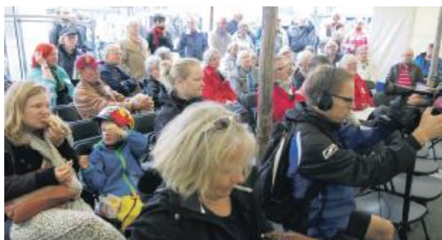
Christianshavnerdagen havde to rigtig gode debatter, den ene om trafikken på Christianshavn, den anden om skole-pladsmangel på Christianshavn. Begge debatter blev fulgt med stor interesse og mange spørgsmål fra borgerne.