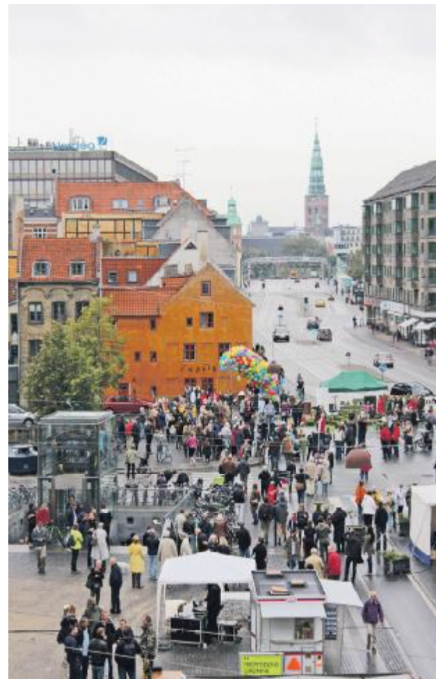
Torvets åbning bliver fejret med at opsende balloner.

Marmorblokkene er slebet på oversiden, så de er behagelige at sidde på, men siderne er præget af borehuller, og har et spændende rå udtryk, som, når solen skinner på dem, fuldstændigt illuderer isfjeldene i Grønland. På én af fladerne har stenhuggeren hugget