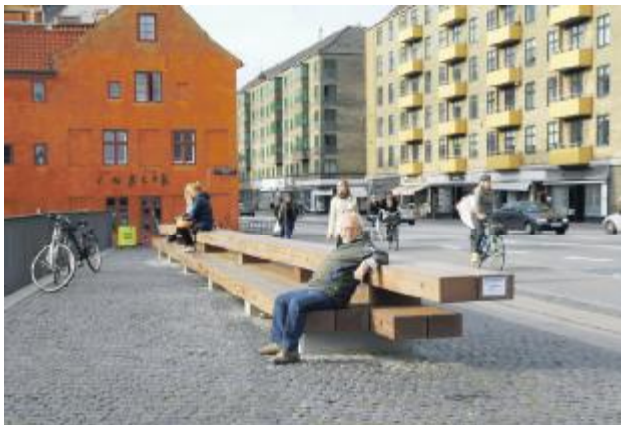
Billedhuggerbænken til søndagsrefleksion

på, at den bliver stående så mange kommende generationer kan nyde den lige så meget, som vi gør!