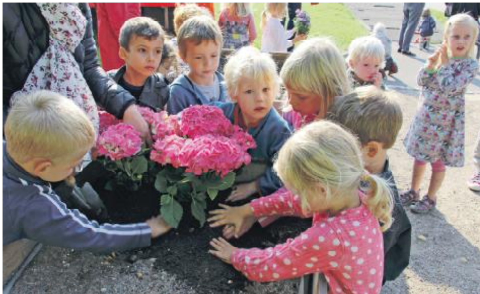
børnene planter Hortensia