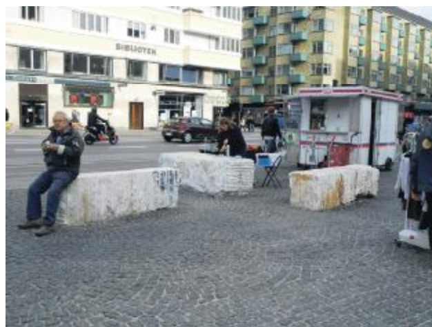
Marmorbænkene i brug

Bænke og cykelstativer skulle løses, så cyklerne kunne gemmes lidt væk og bænkene placeres, så de både kunne skabe gruppe-muligheder og være enkeltstående.