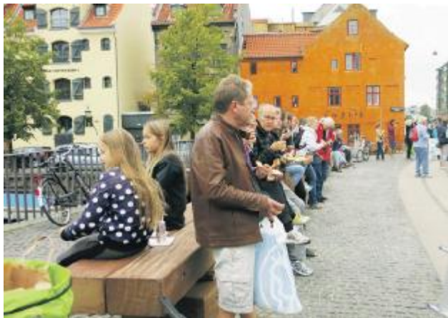
Morgenmad på Billedhuggerbænken