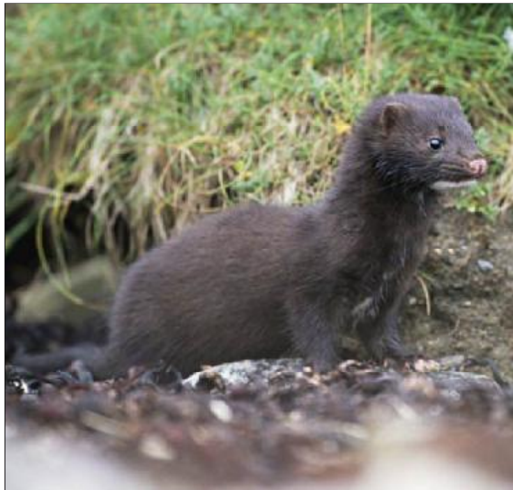
Mink ved søbred

Det er selvfølgelig rigtigt, at der er meget mere menneske- trafik på - og langs - vandet, som forstyrrer fuglene. Men mener skribenten virkelig, at alt bliver bedre ved at etablere et hermetisk lukket naturreservat 2,5 km fra Rådhusårnet til ære for