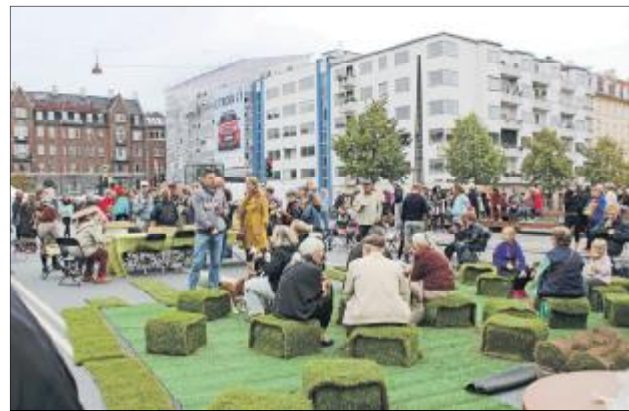
Tænk hvis vi kunne sidde på grønne tænke under træernes skygge

Kiosken blev i sommeren 2014 flyttet længere ind på torvet, men en dag var den pludselig væk! Stor opstandelse, "for det er jo det, som vi altid har frygtet", sagde folk på gaden. Heldigvis var det dels fordi entreprenøren havde støbt fundamentet for højt, så de måtte ændre det, dels havde man ikke været opmærksomme på, hvordan kioskens indretning var placeret, så man havde vendt den forkert i forhold en kommende servicefunktion ind mod torvet ... så kiosken kom tilbage og står rigtig godt dér.