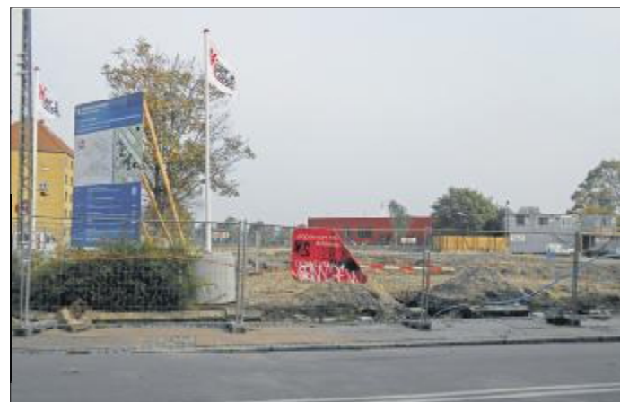
Her kommer Verdens Bedste Børneby...