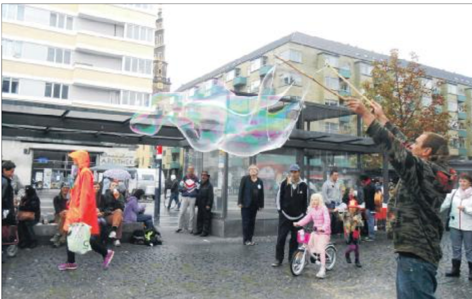
Metroruderne er væk, nu kan vi færdes frit på torvet og der er plads til os alle