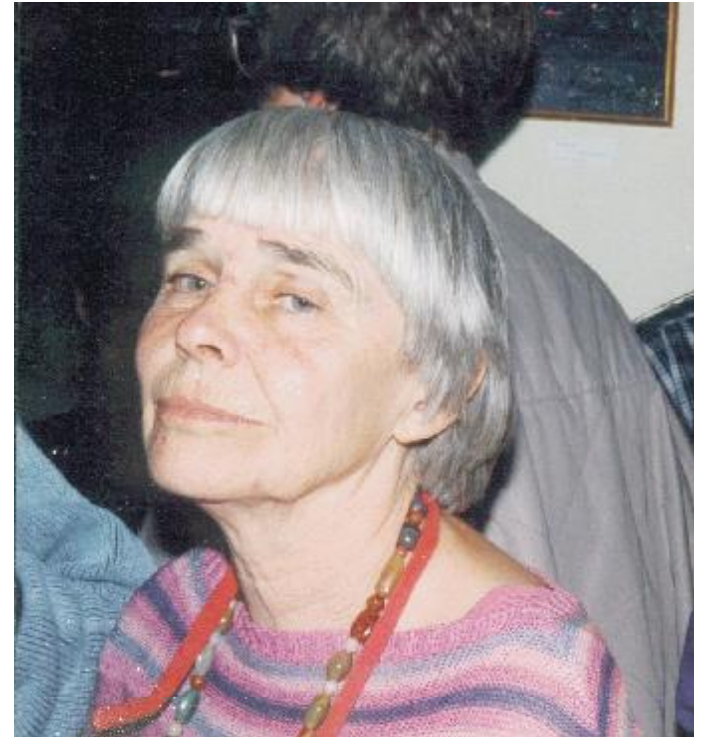
Godt nok har vi bragt det før, men vi synes, det siger så meget om anvar

To udlande har hun især kastet sin kærlighed på, Grønland og Vest Indien, det første land med arbejde og ophold i Pamiut, det andet med besøg og genvisitter.