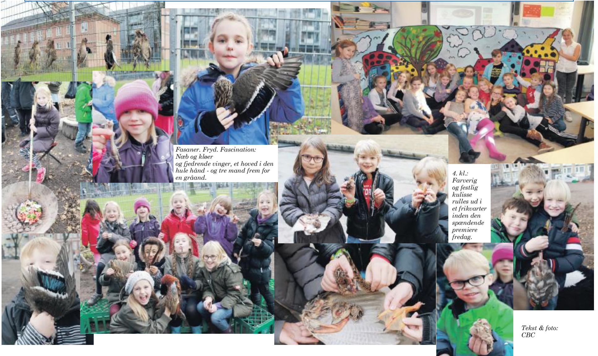
Fasaner. Fryd. Fascination: Næb og kløer og fjedrende vinger, et hoved i den hule hånd - og tre mand frem for en gråand.

CD's 215 års fødselsdag fejres med skuespil, fagdage og i år tillige med middag og fest med lanciers for de store elever.