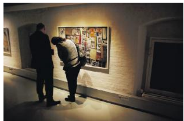
Tilskuere foran fotos af de affotograferede, undersøgte islændinge.

Der har med rette været megen fordømmelse over nazisternes menneskeforsøg og raceteorier, men bygger