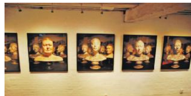
Gipsbuster på stibe af islændinge