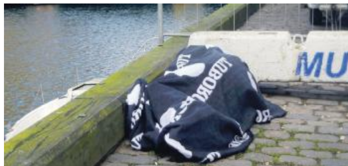
Men smuk handling skal vel også med i CHRISTIANSHAVNEREN. En bruger af Torvet blev overvædet af træthed, og lagde sig derfor mageligt til rette ved bolværket. Servitricen fra den nærliggende bøværtning lagde barmhjerteligt et tæppe over den sovende; det var da smukt!

For at kunne være en del af Borgerpanelet skal du bo på Christianshavn og være fyldt 16 år. Du kan tilmelde dig Christianshavns Borgerpanel på www.christianshavnslokaludvalg.kk.dk . Alle besvarelser bliver behandlet anonymt.