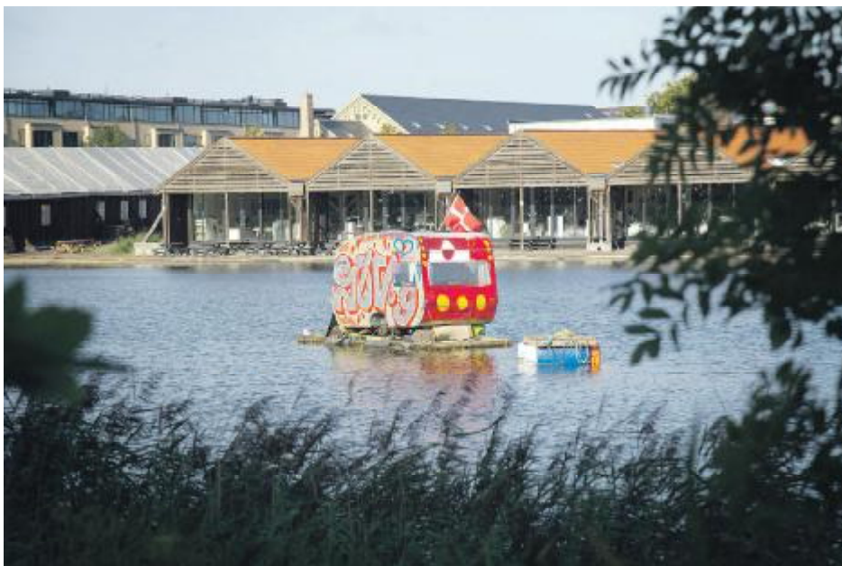
Der ligger en del meget fantasifulde flydende boliger i: "Det flydende kvarter", ved Refshalevej, lige ud for Christiania. Dette er en af beboelserne.

Skonnerten Mira, her med Christianshavn og et nyere fartøj som baggrund, blev bygget 1898 i Faaborg og restaureret 1993-1999.