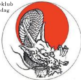
GYOKU RYU KAN DOJO

Bankospillet afholdes for at samle midler til en støttefond som klubben opretter for at alle medlemmer skal kunne få råd til at tage med på træningslejre.