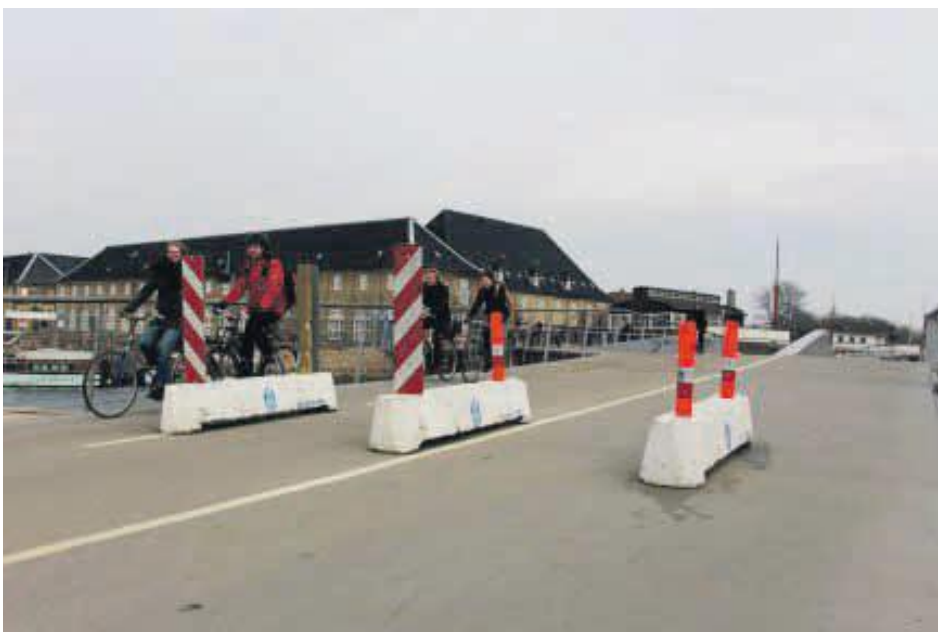
Bilspærreklodser eller "Hans Engell" ved Trangravsbroen