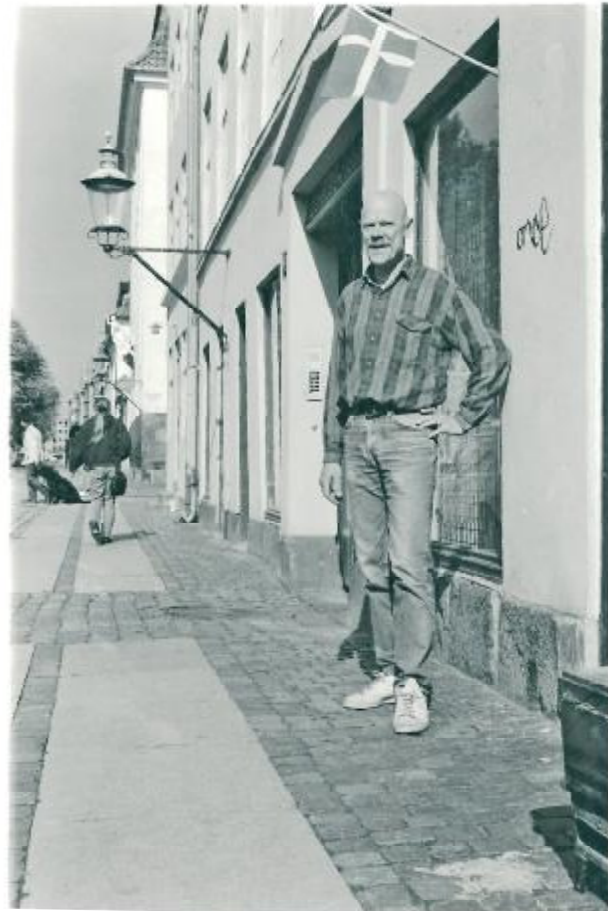
Stort tillykke til Guldsmeden

Efter flere års fast arbejde i Israel og København sprang