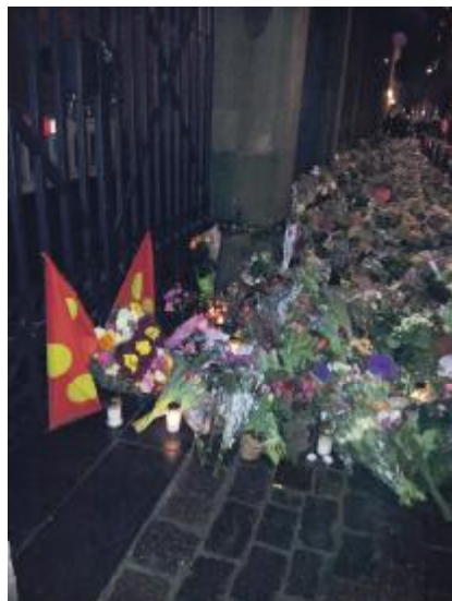
tekst og foto: G., L og A., Christianshavn

Christianshavneren kan hermed bringe spørgsmålet videre?