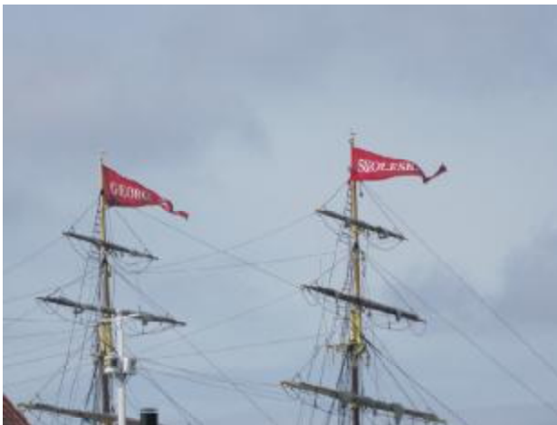
Vimplerne vajer fra skoleskibets mastetoppe med skibsnavnet tydeligt. owu