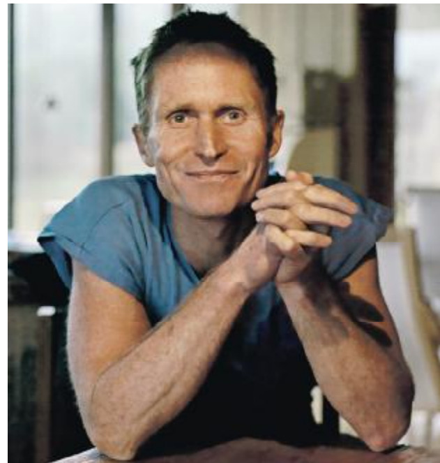
Forfatteren Peter Høeg

Postterminalen ved Hovedbanen er solgt til en pensionskasse. Virksomheden flytter til Hedegaardsvej på Amager. OWU