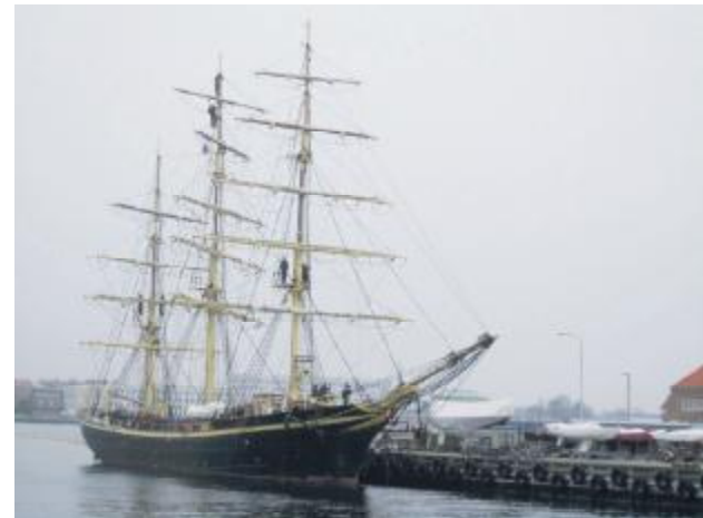
Georg Stage gøres sommerklar.jpg owu

Våren har ramt Christianshavn, og et sikkert forårstegn er, at Georg Stage bliver klargjort til sommerens togt. Her ses den sidste rå blive sat på plads, og snart er det Store Vinkedag.