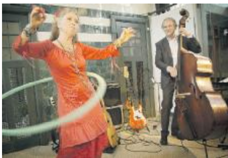
Søndag den 13 september optrådte Anne Marie Helger og Peter Ingemann i Sofebadet, med sange og musik.