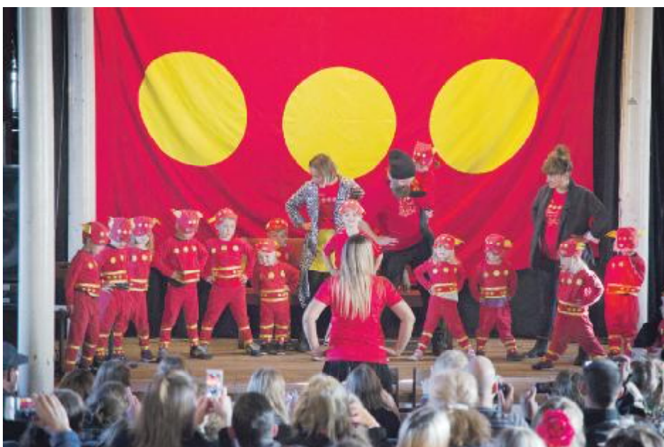
Christianias fødselsdag, 44 år. Morgenmad i Byens lys på Fabrikken.