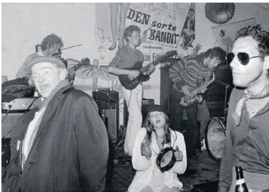
Susanne Mertz har fanget den hyggelige og afslappede stemning, der herskede på koncertstedet 'Månen'