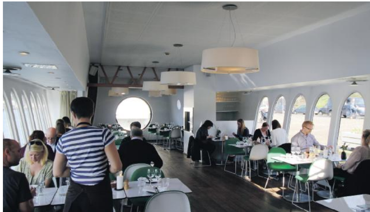
Restaurant Viva bærer ikke præg af tungt skibssaloninventar, tværtimod er møblementet café-agtigt, let og lyst.

I løbet af det 1½ år, Hal C har eksisteret, er der omkring 25 foreninger, som er blevet faste brugere af hallen, og vil man deltage i en forenings aktiviteter indeholder Hal C's hjemme-