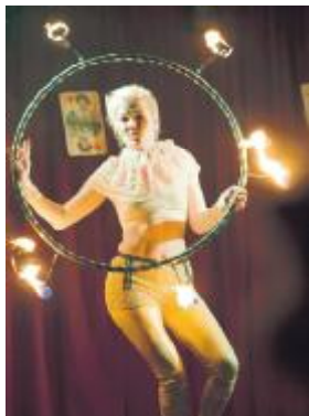
En gogler

5 juni 16:00 til 18:00 Eliel Lazo Quartet