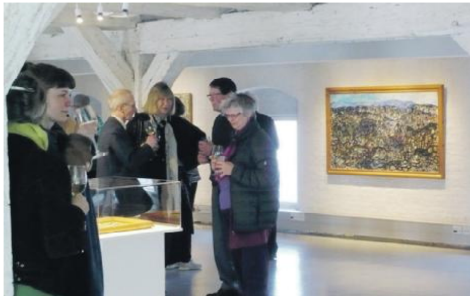
Malerens heftige temperament ses tydeligt i hans vilde malerier, som både er figurative og natur-beskrivende på en provokerende måde, og som inddrager dig på en usædvanlig måde.

Udstillingen kan ses frem til 21. Juni på Nordatlantens Brygge, Strandgade 91. Jane Lythans