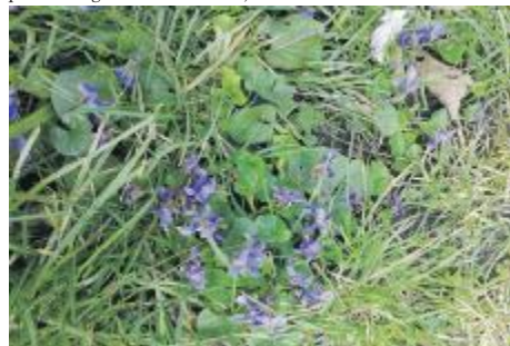
Mens vi længselsfuldt venter på foråret.....

Christiania har en gartnergruppe som har fungeret siden 1975. Gartnergruppen vedligeholder voldene,