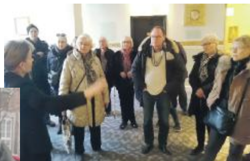
En rundtur på Palace Hotel er det også blevet til - vi kom rundt i diverse kringelkroge og sågar ud på en herlig terrasse højt oppe.

Kom og besøg os og få en aktivitetskalender frem til juni – Download den fra Facebook eller ring til os på 6057 0769, og vi sender pr. mail.