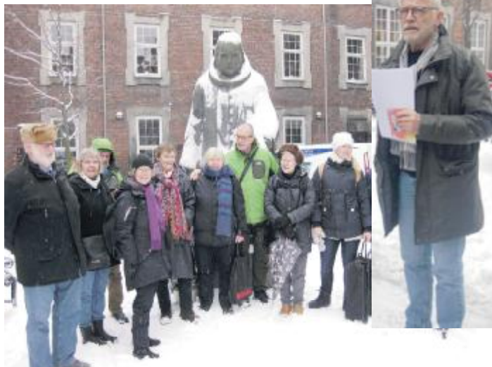
fra udflugten til Vartov, hvor vi fik en spændende historie om husets tidligere og nuværende funktioner, og senere inde i kirken fik vi en summarisk gennemgang af Grundtvigs liv og gerninger.

Vi startede 2016 med at se filmen: Wilsons War. Over en kaffetår/frokost planlægger vi, hvilke film vi skal se den nærmeste tid. Ture ud af huset i foråret er fastlagte. Vi har været på Vartov (meget spændende foredrag om Grundtvigs liv og virke) – og i Skuespilhuset, hvor nogle så forestill-