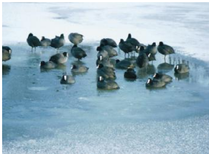
Blishøns i Voldgraven