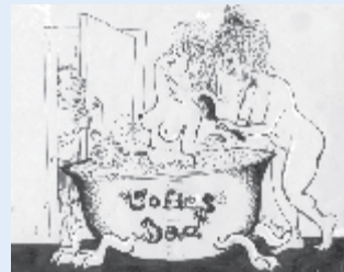
Foreningen Sofiebadet, Sofiegade 15 A-B, 1418 København K