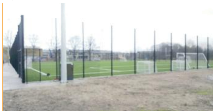
De fine nye baner, som må stå ubrugte hen pga kommunens manglende sans for langtidsplanlægning.