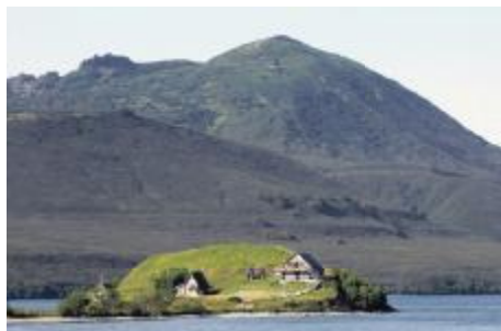
Da Beringekspeditionen nåede frem til Stillehavet, blev skibet Sct. Gabriel bygget og Bering sejlede langs Sibiriens østkyst op til nordkysten (Nordostpassagen) og opdagede at der var et stræde mellem Asien og Nordamerika.