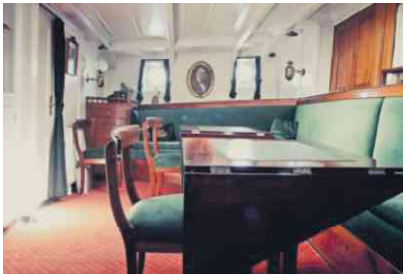
Kaptajnens maghonisalon er et af skibets mange bevaringsværdige interiører.

W: computerambulancen.dk T: 53 578 777 Dronningensgade 49, DK-1420 K