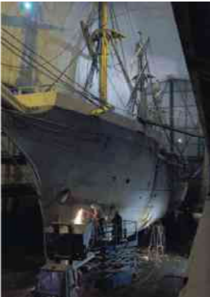
Der arbejdes med stålet i Assens værfts overdækkede flydedok