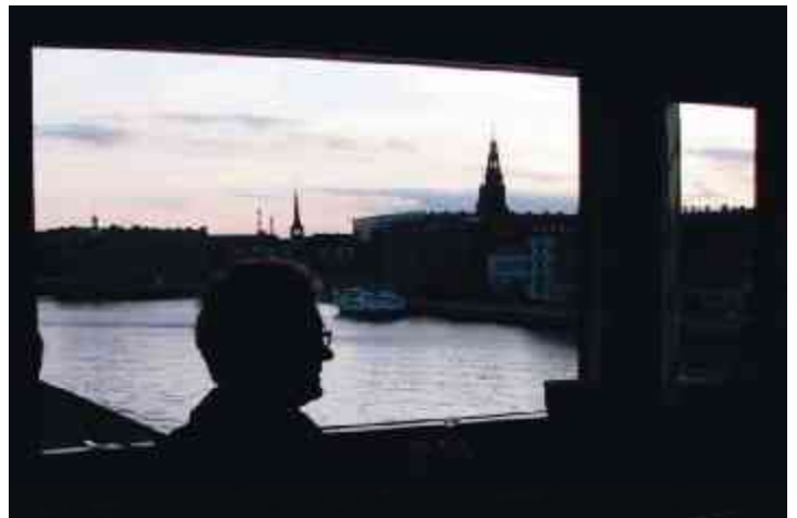
Her er vores bud på et billede inspireret af Hammershøi.