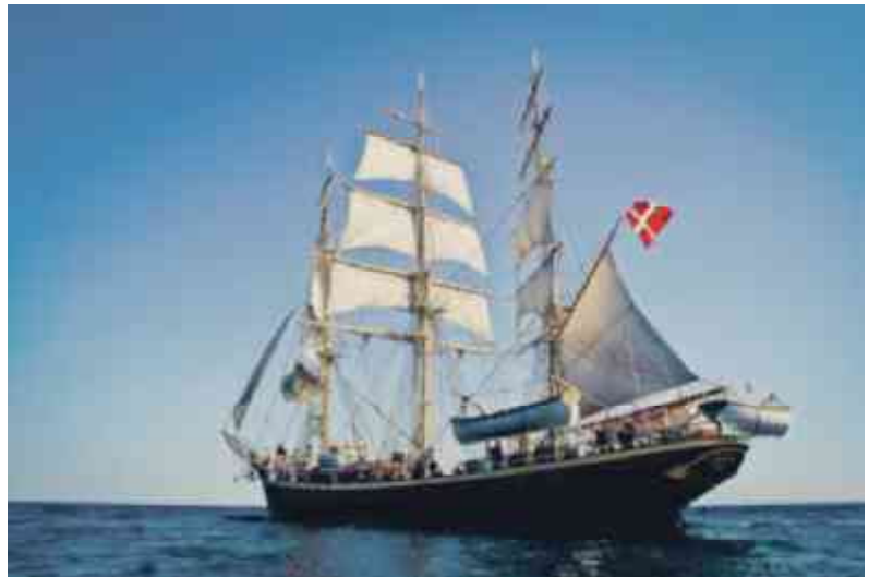
Georg Stage braser bak i Øresund

Efter at have været på væft i Assens sejlede Georg Stage 1. marts tilbage til sit vinterkvarter på Holmen efter fire forbedringsmåneder.