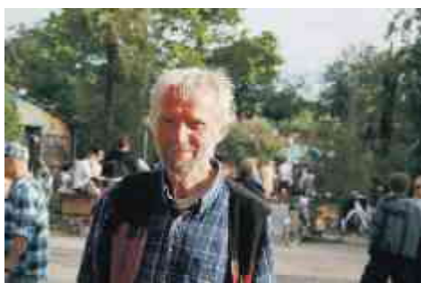
Peter Thiel (Arkivfoto)