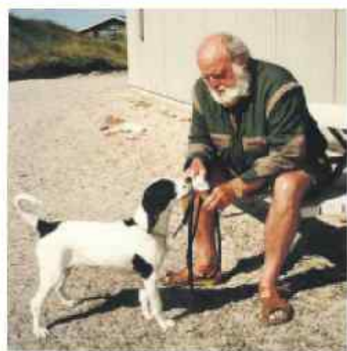
Johs med Fif, som i grænsen bemærker småt tryk i beude og flyde.

e-mail: christianshavneren@beboerhus.dk www.christianshavneren.com