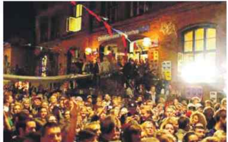
Gadefest i anledning af Beboerhusets 35 års eksistens

betjeningen og sagsbehandlingen, herunder ved at forvaltningernes topledelse engagerer og involverer sig i dette. Og der er brug for at give plads til og understøtte den ordentlighed, som trives sammen med fagligheden og giver mulighed for at give den bedst oplevede borger-service og den bedst mulige sagsbehandling. Det handler i høj grad om medarbejderne, deres rammer og ledelse samt ikke mindst om deres faglighed og serviceetik og muligheden for at udleve den.