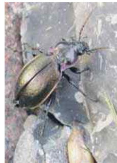
På billedet ses en Løbebille.

Grunden til at insekter er så overlevelsesdygtige er, at deres skelet sidder uden på som et hudskjold, der beskytter mod udtørring og ydre slag. Yderligere giver deres membranløse områder mellem leddene muligheden for at kunne bevæge sig hurtigt og smidigt, når de enten løber, springer eller flyver.