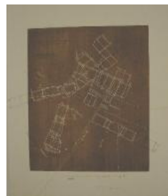
to træsnit af Ester Fleckner