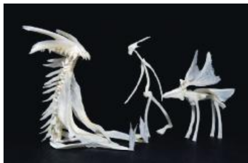
bæredygtigt legetøj af fiskeben ved Róshildur Jónsdóttir

Model sættet kan købes i receptionen på Nordatlantens Brygge.