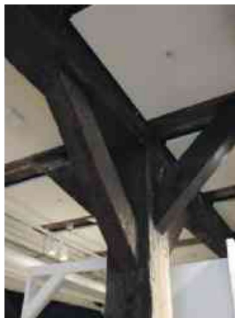
De smukke gamle tomrærbøjer ses i loftet i Flying Tigers nye – men gamle administrationsbygning/pakhus.