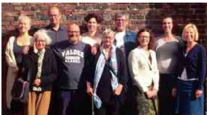
Et udvalg af de opstillede fra Samarbejdslisten Severin.

Og for os fra Samarbejdslisten Severin er Menighedsrådsvalget en rigtig vigtig begivenhed. Vi er nemlig en flok entusiastiske, nysgerrige og åbne mennesker, som gerne vil vælges til menighedsrådet fra januar 2017 og 4 år frem. Vi kalder os som sagt Samarbejdslisten Severin efter gode gamle Nikolaj Frederik Severin Grundtvig (præst ved Vor Frelzers 1822-1826), som om nogen lagde vægt på at samarbejde med Gud og hvermand og det ønsker vi at efterleve de næste 4 år. Vi spænder vidt i alder og kirkeligt tilhørsforhold til Vor Frelzers og vi ved vi kan tilføre sognet nye og friske tiltag og bakke op om kirkelivet til glæde for alle. Vi er meget interesserede i at hilse på sognets beboere og her på siden kan I læse mere om os, og hvad vi ønsker at