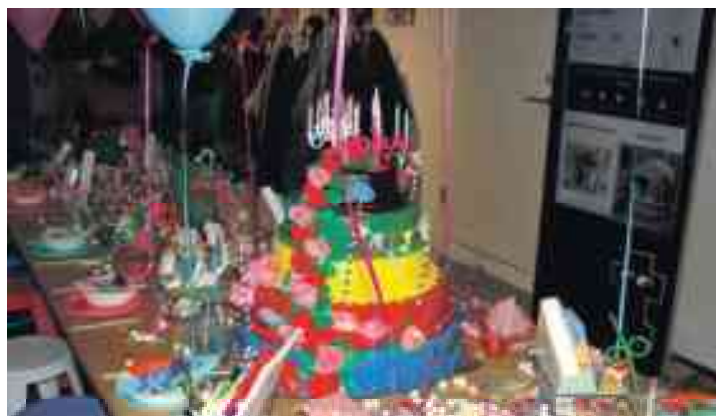
Fra den festlige reception ses opstilling til børnefødselsdag.

Virksomheden startede i 1995, som det er nogen bekendt, på Islands Brygge med butikken Zebra, som senere skiftede navn til Tiger