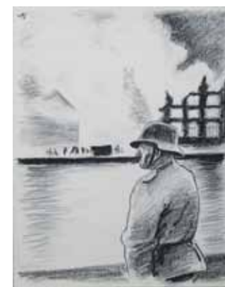
Da sukkerhuset brændte

og dystre. Til hver enkelt tegning er der ud over titel en lille tekst, der forklarer hvad den forestiller.