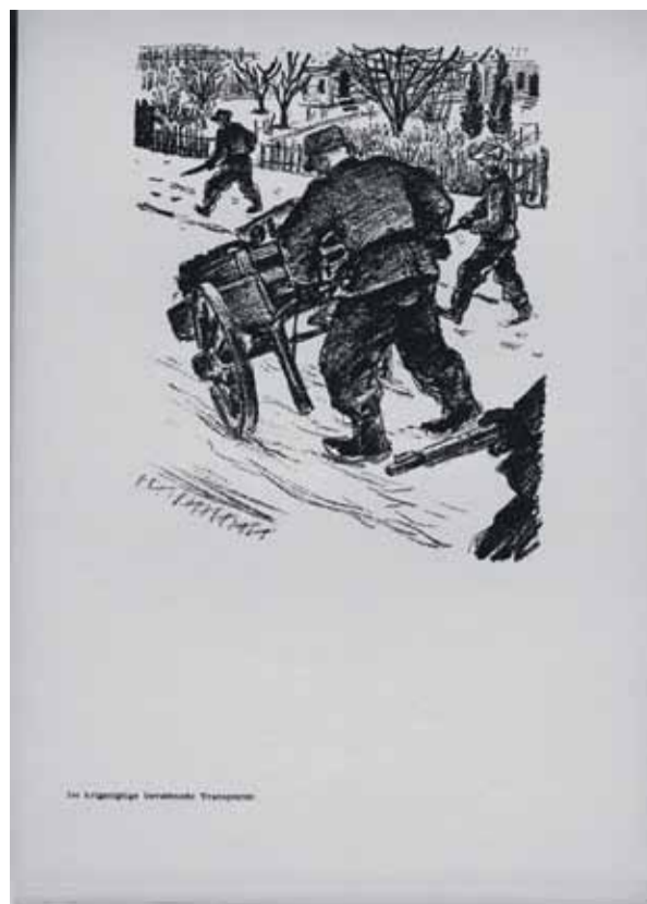
De krigsvigtige bevæbnede transportere