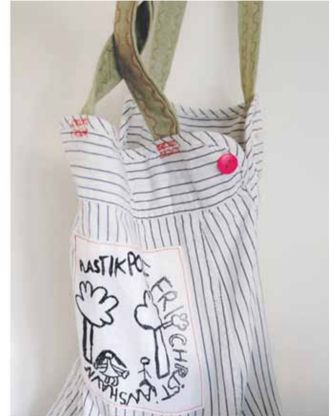
Ærmer fra en skjorte kan blive til en fiks lille taske.

Følg med på vores Facebookside, der står altid sidste nyt og opslag om eventuelle ændringer.