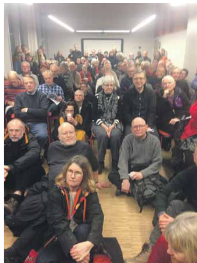
Udsnit af de mange tilhørere ved mødet om Kuglegården.

Christianshavns Lokaludvalg er nedsat af borgerrepræsentationen efter indstillinger fra Lokalområdet.