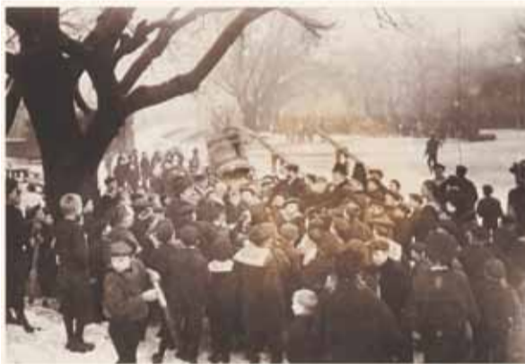
Christianshavn år 1900 ( ved legepladsen ? )