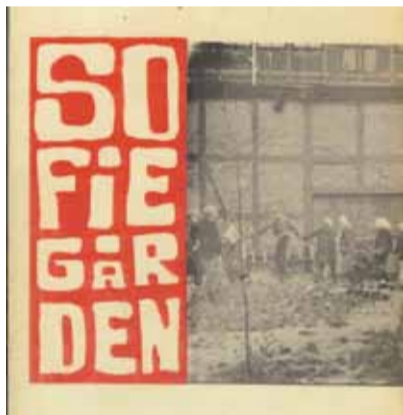
Slagey om Sofiegården mindes i disse dage ;Mere herom i næste nr. af avisen

Hovedsagen kan være, at der ved salget af Nyholm bringes flest mulige penge i Statens kasse, som så kan bruges på at forstærke det danske forsvar, så det kan tilfredsstille en venligsindet stormagt, som vil hjælpe os i nød og trang. Måske. owu