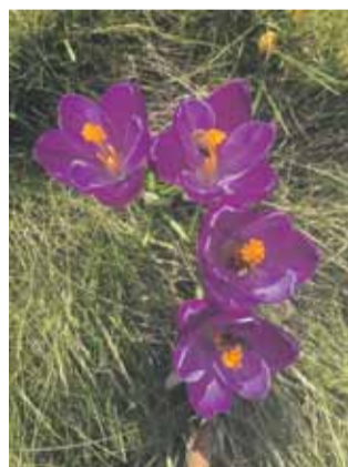
Aktive bier og blomster, spottet på en februardag af ebb.