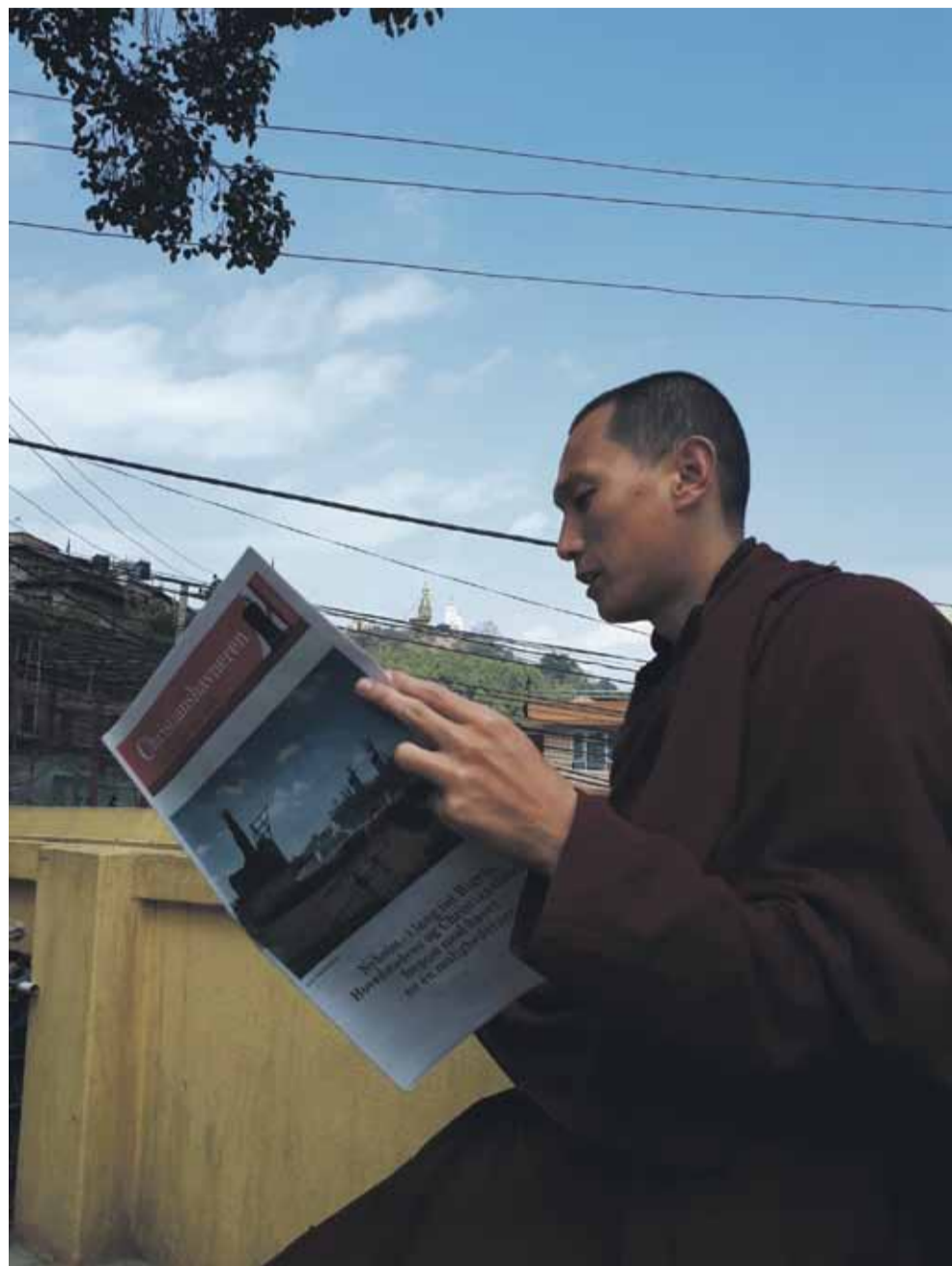
Her er avisen nået til Katmandu, Nepal, hvor en munk ivrigt studeret den