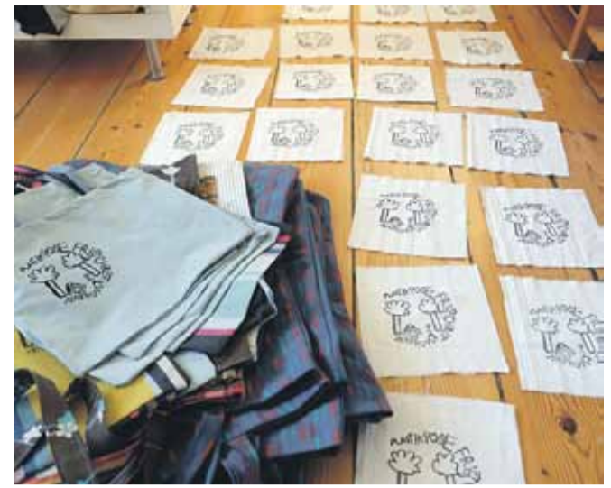
Logo trykkes enten direkte på posen eller på en lille lap, der sys på de mørke eller mere mønstrede poser.

Vi syr og syr, og vi syr både i privaten og i Christianshavns Beboerhus. Vi syr i alle mulige designs, og tit er det stoffets bredde eller et sjovt mønster, der bestemmer størrelsen på poserne. Eller måske et skjorteærme, der inspirerer til en lille taske.