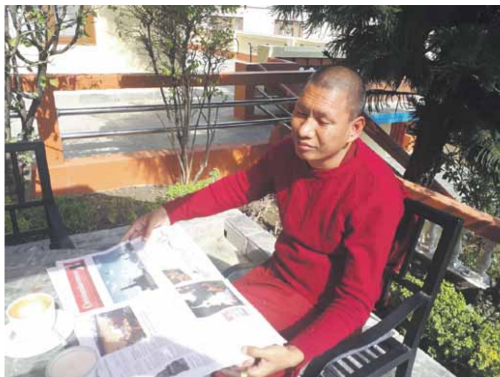
I denne måned nåede Christianshavneren til Nepal. Husk: I er velkomne til at dokumentere Avisen i spændende omgivelser, i ind- og udland Tekst & foto: ebb

B BANG & BEENFELDT RÅDGIVENDE INGENIØRFIRMA