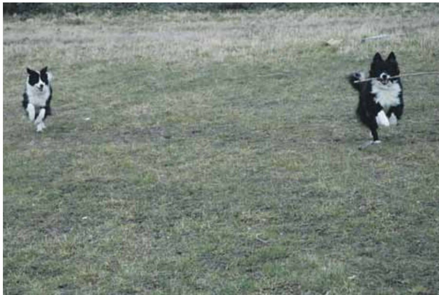
Fri leg på Refshaleøen.