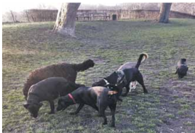
Avishunden og dens venner.