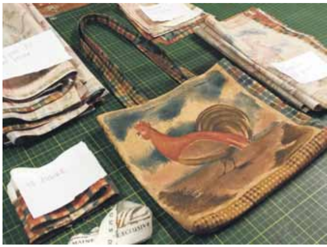
Tit bestemmer mønsteret hvor stor posen bliver. Her får hanen fuld opmærksomhed på en mindre pose.