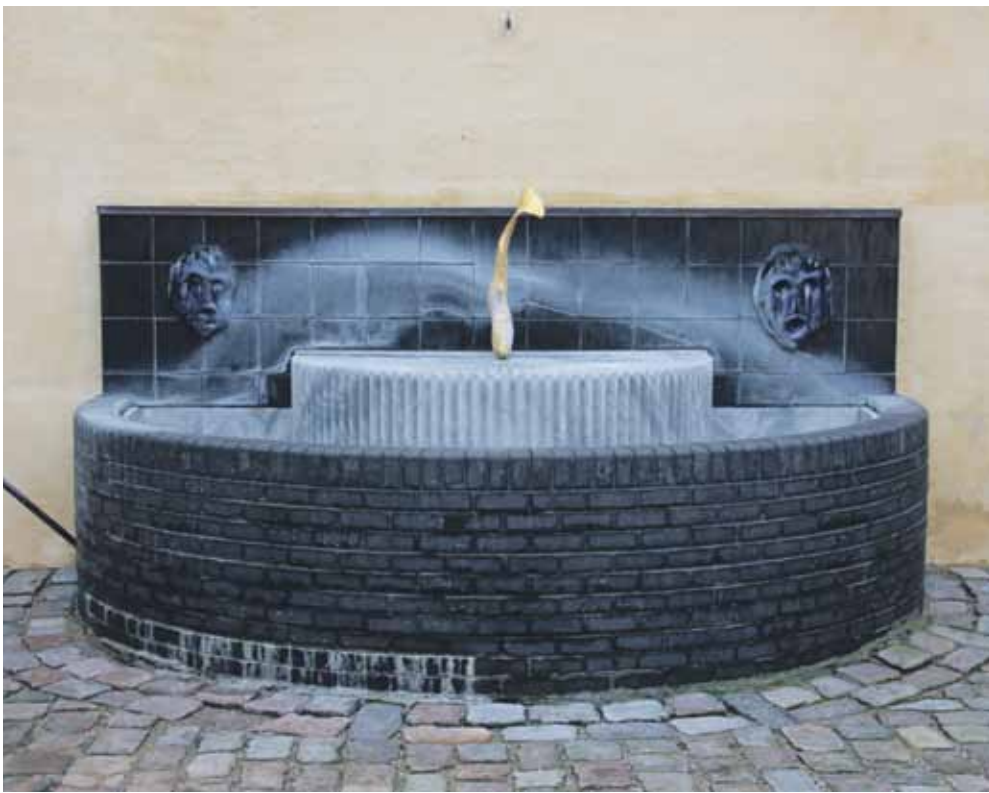
Kilden springer i Heerings Gaard