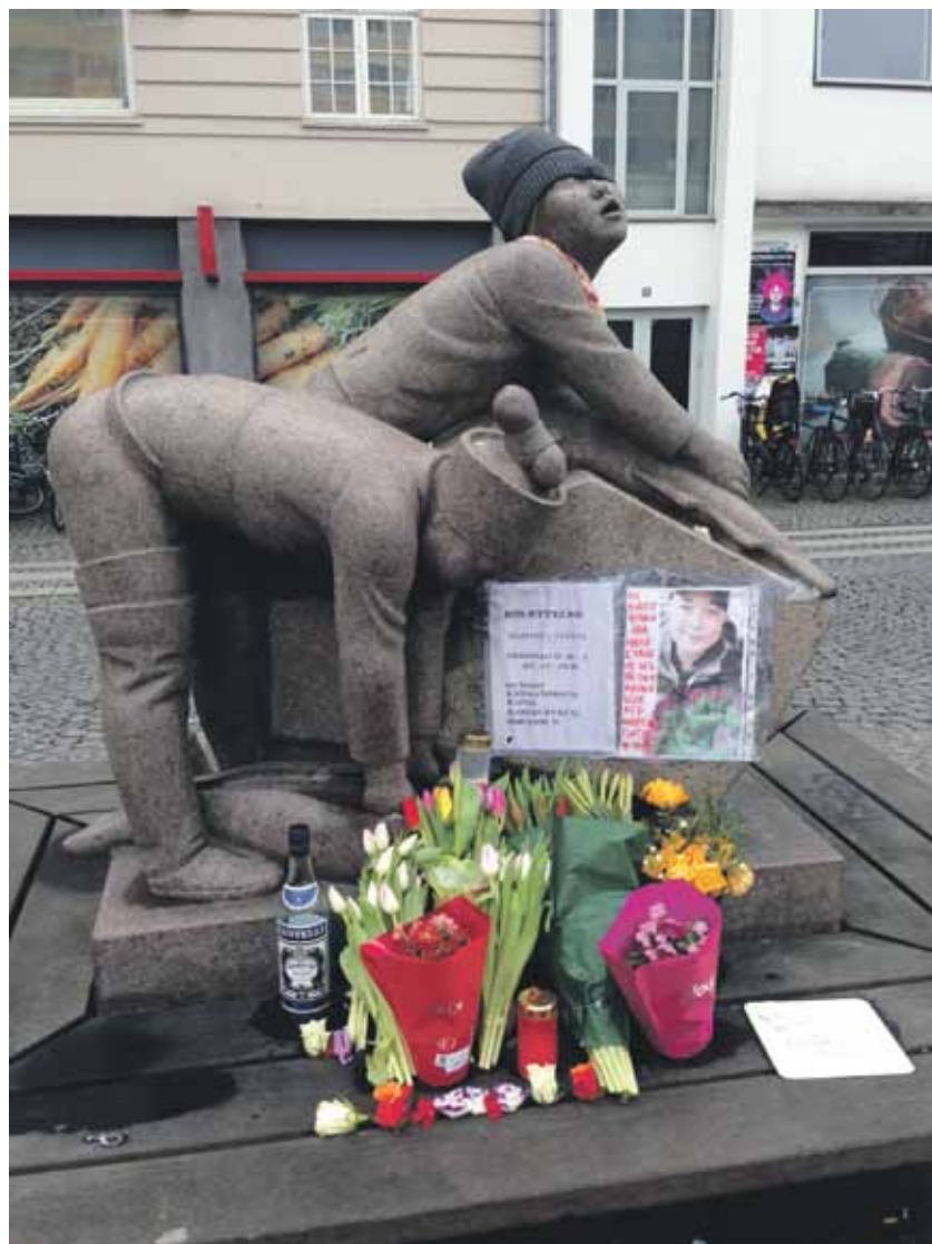
Et sidste farvel til en kammerat.

På grund af sygdom intet nyt fra Døttreskolen