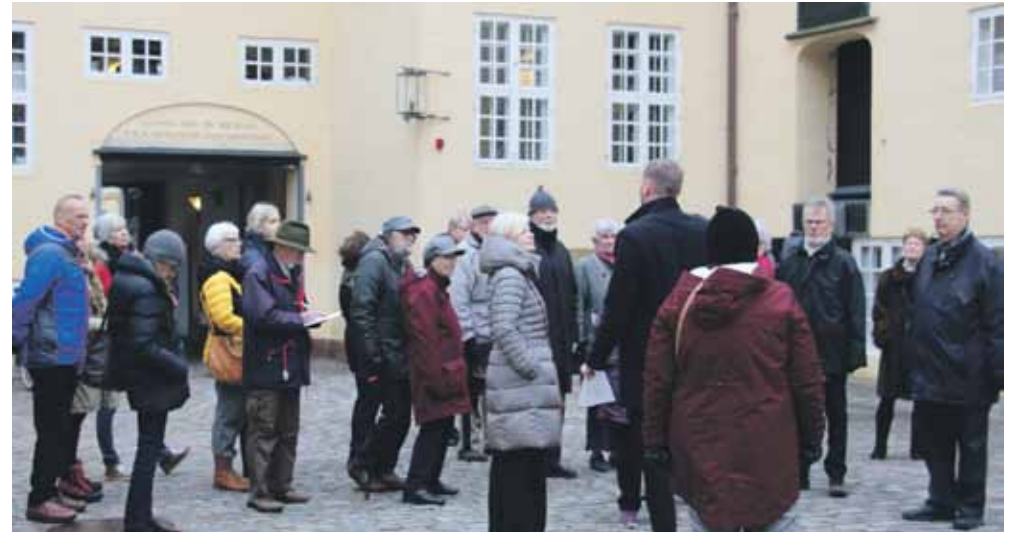
De særrundviste i Heerings Gaard

Bank- og Sparekassemuseet indbød til særrundvisning på Bank- og Sparekassemuseet i Heerings Gaard onsdag 16. januar kl. 14.