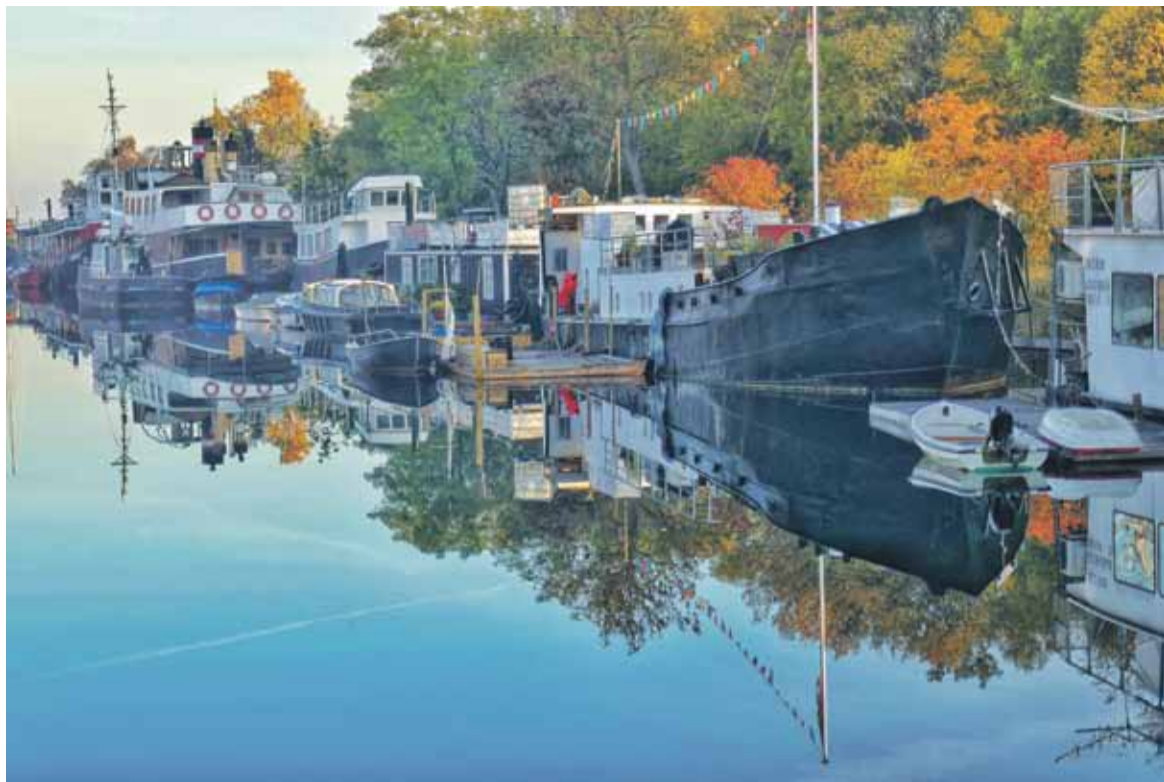
Løvfaldssommer på Krudtløbsvej, Holmen