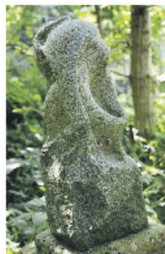
Lone Arendal udstiller