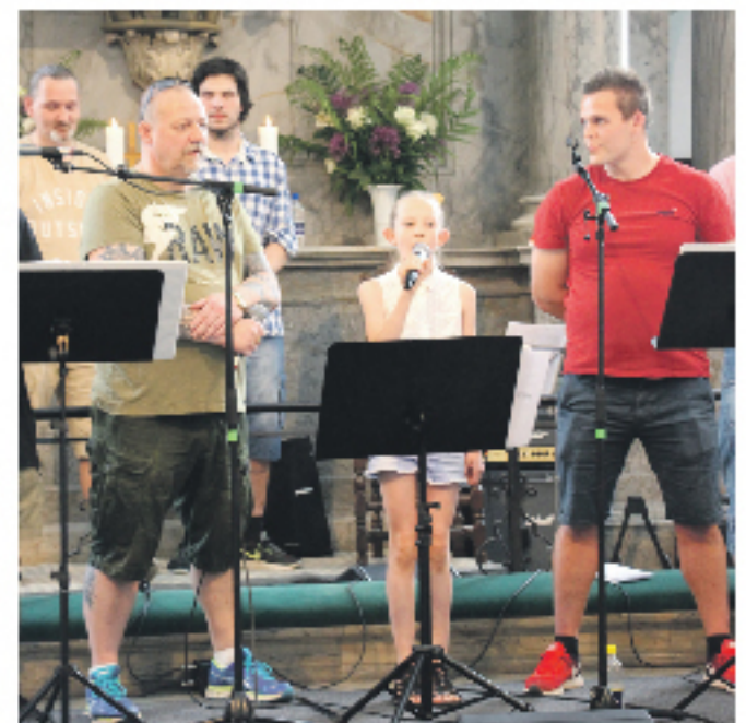
Fangekoret i Christians Kirke