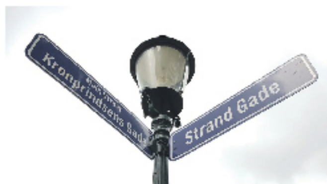
Gadebillede fra Charlotte Amalie i hundredret for overleveringen til USA.