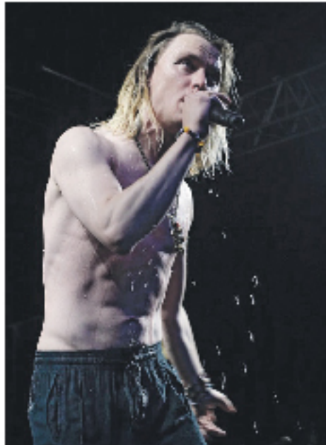
Bisse på Nemoland