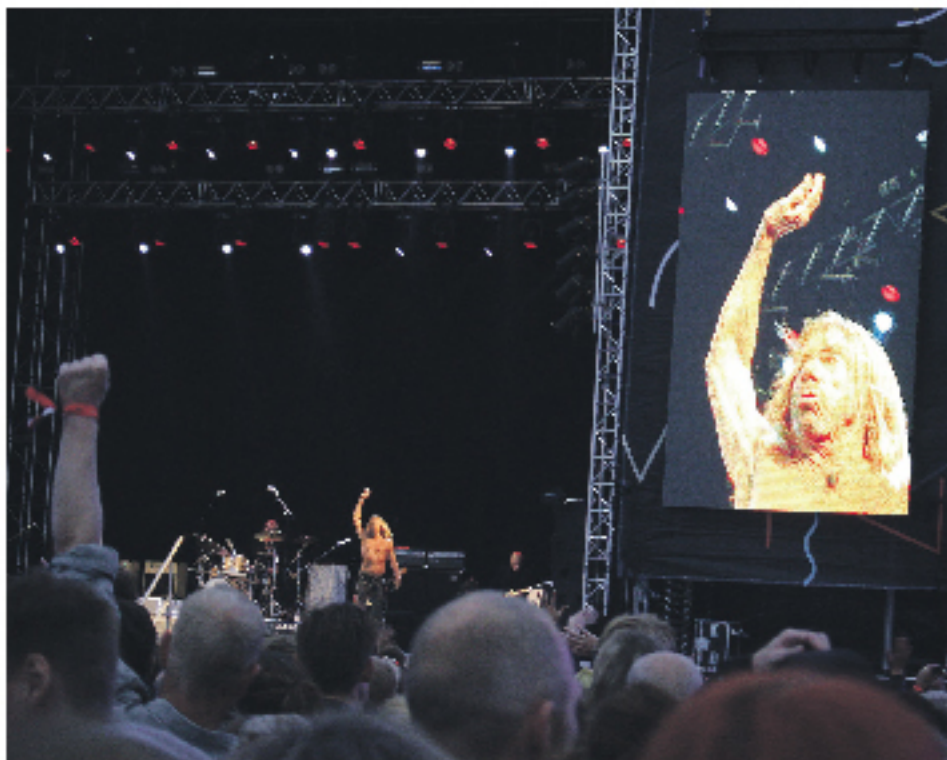
Iggy Pop på Halvandet