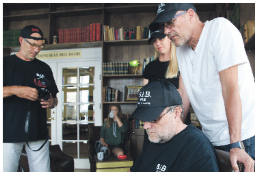
Deltagere på filmholdet arbejder....