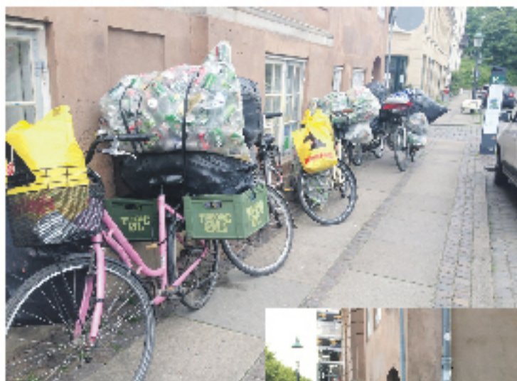
Her et par fotos, der tydeligt viser, hvordan fortovet var spærret af cykler - og hvordan det atter er plads også til barnevogne, når cyklerne er rykket rundt om hjørnet

Vi har i det hele taget et ønske om at være på god fod med naboer, erhvervsdrivende, forbipasserende m.m. og forsøger derfor at være lydhøre i forhold til hvilke udfordringer, det giver at have en varmestue midt i et boligområde. Vi hører også