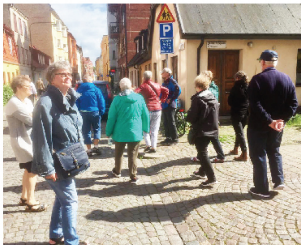
Gruppe på besøg i Sverige....