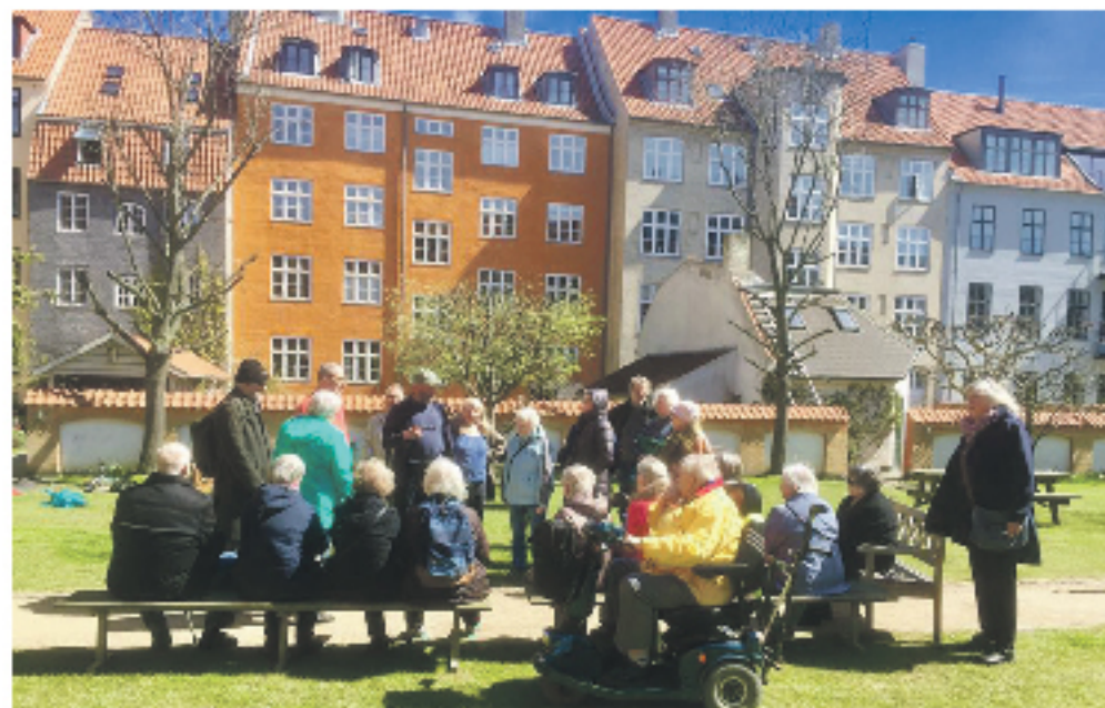
udflugt med foredrag....

Åbningstider: mandag, tirsdag og torsdag 10.30-15, Rådhusstræde 13, 2 sal, 1466 Kbh. K