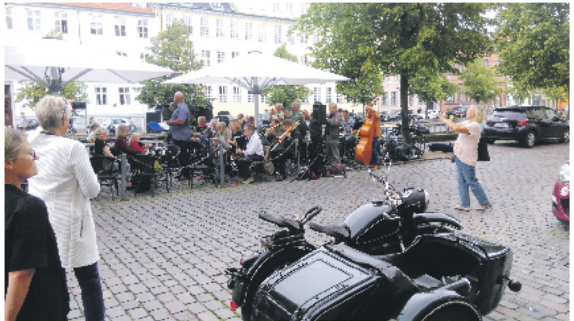
Big Band på Bolværket.