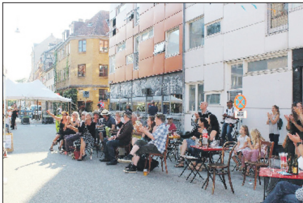
Sidste års gadefest på Christianshavnerdagen - pressefoto

Som sædvanlig – på trods af ferie – har sagerne spadseret rask ind på vort bord. Og det er jo egl. positivt, for det giver os mulighed for at blive hørt. Men det belaster jo de tapre frivillige. De væsentligste har nok været: